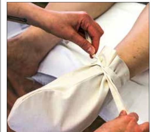
Während der Einwirkzeit der Maske ruhen die Füße in Baumwoll-Füsslingen.

zen Welt per Internet bestelle», lacht Kahraman. Sind die Füße dann von Schuppen und abgestorbener Haut befreit, folgt eine Vitamin-E-reiche, nährnde und wohltuende Fussmaske mit ätherischen Ölen. Auch diese selbstverständlich aus Eigenproduktion. «Hier verwende ich weisse Tonerde, die reich an Mineralien ist. Diese Behandlung ist besonders gut für trockene Haut», erklärt die Beinwilerin. Während der Einwirkzeit serviert sie einen feinen Tee, bei dem man die Seele baumeln lässt. Nach der Maskenentfernung folgt eine wohltuende, stoffwechsellanregende Fussreflexzonenmassage. Nebst der reichhaltigen Fusspflege ist auch der Fussshamam eine Wohltat für die Füße. Hier erfolgt nach Fussbad und Fusspflege ein sanftes Peeling mit natürlicher Lorbeerölseife und ebenfalls einer Fussreflexzonenmassage. Gönnen Sie sich ein Stück Orient.