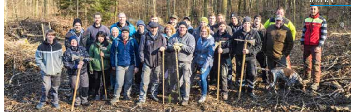
Das Werk ist vollbracht: Die Baumpflanzer der Makiol Wiederkehr AG mit den Verantwortlichen des Forstbetriebes aargauSüd (r.).