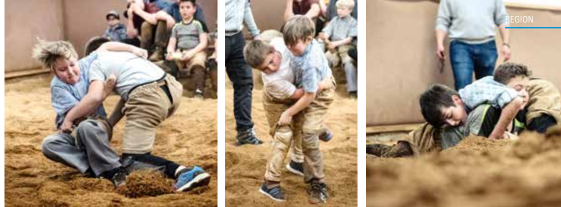
Der Nachwuchs des Schwingklubs Kulm ging beim 38. Becher-Schwinget beherzt zur Sache.