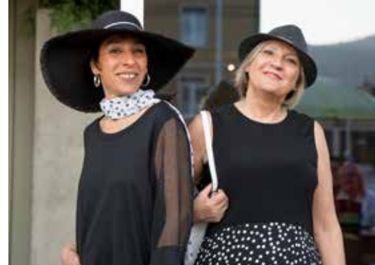
Ob Schwarz, Pastell oder knallig in Pink: Der Modesommer hat farblich viele Gesichter. Und der Hut ist mehr als nur Schattenspende.