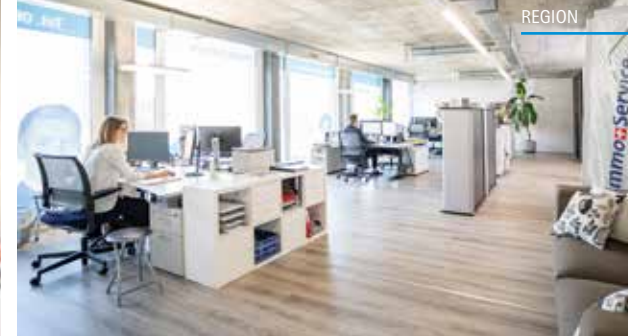
Wo Kompetenz zu Hause ist: Elena und Andreas Bräm in den hellen Büroräumlichkeiten an der Tellstrasse 94 in Aarau.