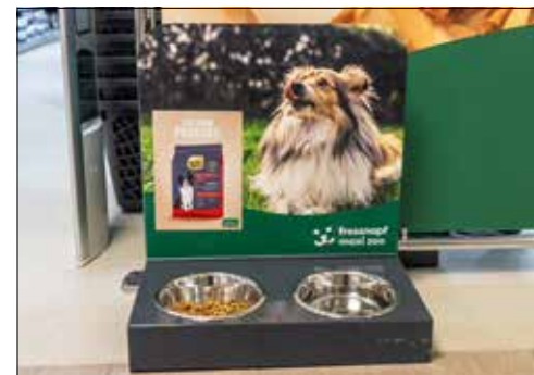
Hunde können gleich ihr neues Leckerli probieren.

nen Bereich mit Zubehör für Nagetiere. Bereiche wie Reptilien- und Fischbedarf sucht man in dieser Filiale hingegen vergeblich. Dennoch besteht die Möglichkeit, sämtliche Produkte über das Bestellsystem der Filiale zu beziehen, was das Sortiment erheblich erweitert. Die Eröffnung unterstreicht das Bestreben von Fressnapf, auch in kleineren Filialen ein breites Angebot und kompetenten Service zu bieten. Ein Besuch in Reinach lohnt sich, um das vielfältige Angebot kennenzulernen und die freundliche Atmosphäre vor Ort zu erleben.