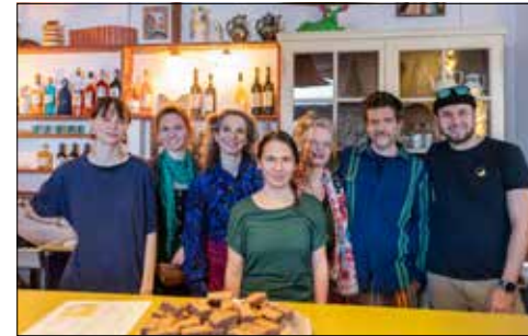
Das Team des PLOPP freut sich auf jeden Besuch.

Am Sonntag, 15. Dezember, um 14 Uhr eröffnete das PLOPP, ein Pop-up-Café mit Kultur in der ehemaligen Schaltherhalle am Bahnhof in Beinwil am See. Mit der Ausstellungseröffnung Husmann/Tschaeni startet das als kulturelle und kulinarische Zwischennutzung eingerichtete PLOPP.