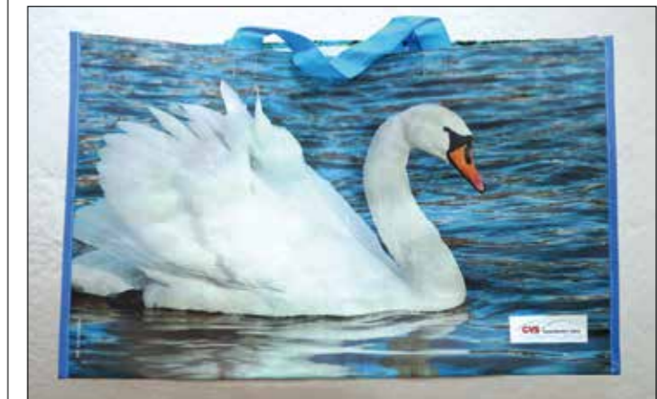
Leistet gute Dienste: stabile GVS-Einkaufstasche.