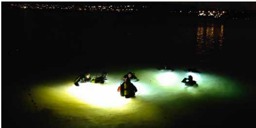
Die sieben Taucher der Tauchgruppe Hallwilersee tauchen spät am Abend in den Hallwilersee ein.

Die Tauchgruppe Hallwilersee taucht mehrmals die Woche. Im Winter ist es vor allem die Kälte, welche den Tauchern zu schaffen macht – auch am Hallwilersee.