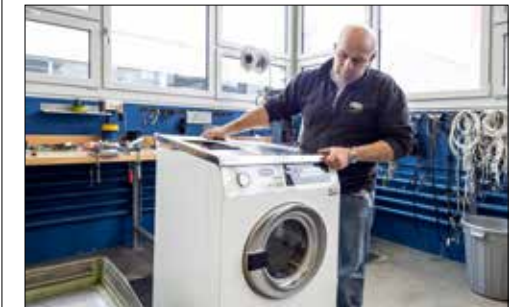
Bevor der Deckel endgültig auf die Waschmaschine kommt, durchlaufen die Geräte einen intensiven Test-Waschgang (links).