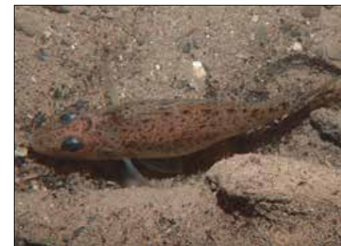
Ein Kaulbarsch schwimmt auf dem Grund des Hallwilersees.

habe ich keinen Wels gesehen. Und es war wirklich sehr kalt», lacht sie. Nach 61 Minuten kommt auch die dritte und letzte Gruppe aus dem Wasser. Und kann einen Erfolg verbuchen: «Unter den Blättern hat sich ein Wels versteckt», lacht Koch. Und die Sicht? «Wir waren auf 21 Meter unten und die Sicht war wie erwartet miserabel.» Zurück im Parkhaus fachsimpeln die Taucher über die Fische und den See. Trocken schälen sie sich aus ihrem Anzug. «Zum Glück hatte ich meine Heizung dabei», schmunzelt Peter Hunziker und macht sich zufrieden mit seinen Kollegen Richtung Restaurant Schiffplände. Auch das ist die Tauchgruppe Hallwilersee – kollegial und freundschaftlich.