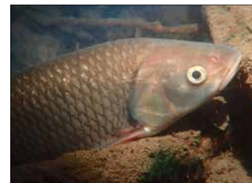
Auch Karpfen tummeln sich im Hallwilersee.