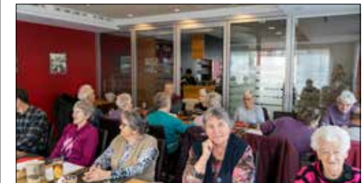
Mittagstisch im Rote Leu: Jeden 2. Freitag im Monat.