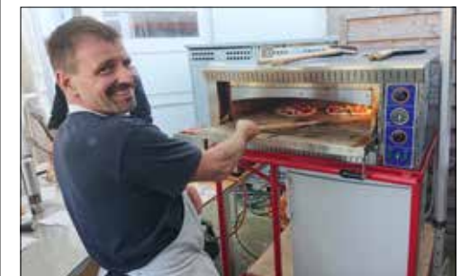
Der Feuerwehrverein Dürrenäsch-Leutwil am Pizza backen.

auch die Festwirtschaft. Zum ersten Mal vom Feuerwehrverein Dürrenäsch-Leutwil organisiert. Und die Männer in den Kochschürzen sorgten für einen neuen kulinarischen Höhepunkt: Pizza aus dem Pizzaofen. Die Nachfrage war extrem gross und die Festwirtschaft daher sehr gut besucht. Und was gibt es schöneres, als sich nach dem feinen Essen auf das bequeme Sofa zu setzen? Und da wären wir wieder bei der Relax-Abteilung von Comodo. Nicht wenige nahmen mit vollem Magen den Aufstieg in den 3. Stock in Kauf. Es warteten ja bequeme Sofas zum Probesitzen.