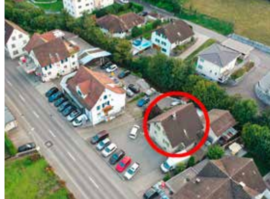
Anstelle der Liegenschaft (roter Kreis) erfolgte der Neubau der 14 Meter langen und 8 Meter breiten Werkhalle.