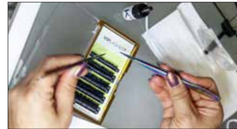
Der Beauty-Trend: Wimpern-Extensions von VIP-LASHES.

(jlo) – An der Unterdorfstrasse 20 in Seon wird man von A bis Z verwöhnt und verschönert. Ob Wimpern-Extensions, Gel-Nails, Permanent-Make-up oder professionelle Haarentfernung, hier werden Kunden von medizinisch ausgebildetem Fachpersonal betreut. Für den Traum von vollen Wimpern mit Länge und Schwung gibt es professionelle Wimpern-Extensions. Für gepflegte Hände mit makellosen Nägeln bietet sich die Gelmodellage in Form einer Naturnagelverstärkung, einer Tip-Modellage oder einer Schablonen-Modellage an. Bereits nach einer Dreiviertelstunde verlässt man das Studio in Seon mit perfekten Gel-Nägeln. Für alle, die gewisse Körperpartien nie mehr rasieren, epilieren oder