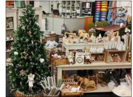
Der nordische Stil hat in der Boutique Einzug gehalten.