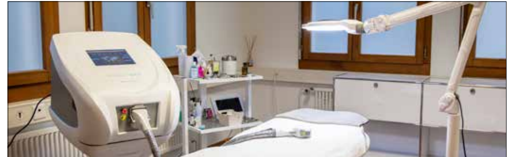
Der stärkste Dioden-Laser für dauerhafte Haarentfernung. Schnelle und wirksame Haarentfernung für alle Hauttypen das ganze Jahr.

Sanfte, glatte Haut: Einfachste und sicherste Diodenlaser-Technik bei Beauty by Kisamano in Seon. Mit neuer Technologie können nun auch Personen mit blonden, roten und ganz feinen Haaren im Lasercenter die störende Behaarung entfernen lassen.