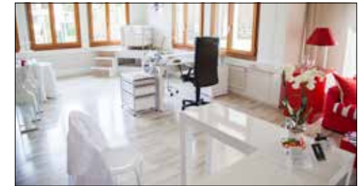
Im offenen und hellen Lasercenter fühlt man sich sofort wohl.

(jlo) – An der Unterdorfstrasse 20 in Seon wird man von A bis Z verwöhnt und verschönert. Ob Wimpern-Extensions, Gel-Nails, Permanent-Make-up oder professionelle Haarentfernung, hier werden Kunden von medizinisch ausgebildetem Fachpersonal betreut. Für den Traum von vollen Wimpern mit Länge und Schwung gibt es professionelle Wimpern-Extensions. Für gepflegte Hände mit makellosen Nägeln bietet sich die Gelmodellage in Form einer Naturnagelverstärkung, einer Tip-Modellage oder einer Schablonen-Modellage an. Bereits nach einer Dreiviertelstunde verlässt man das Studio in Seon mit perfekten Gel-Nägeln. Für alle, die gewisse Körperpartien nie mehr rasieren, epilieren oder