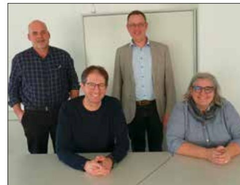
Auf dem Bild eine Delegation der Vertragsparteien nach der Vertragsunterzeichnung.

Der Verein Katzenhübel führt den Heimbetrieb «Höchweidhus» seit 1. April 2021. Der Landwirtschaftsbetrieb soll in absehbarer Zeit als ProSpeciaRara-Archehof aufgebaut werden und der Bevölkerung als Begegnungszone dienen.