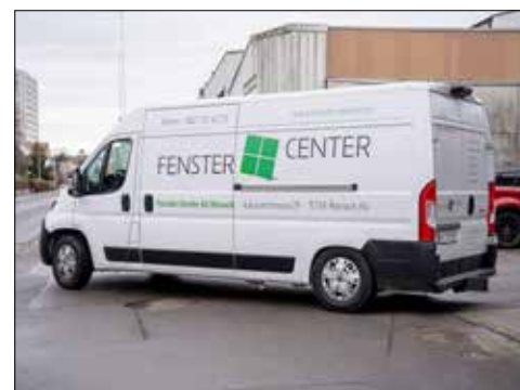
Die fahrende Werkstatt für Notfälle und Servicearbeiten.