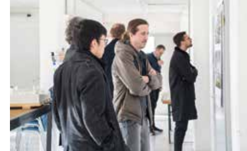
Die verschiedenen Projekte wurden genau studiert.

vorsichtig bis zu den Reiheneinfamilienhäusern im Zentrum. Ein zentraler Platz (Korki-Platz) bietet Aufenthaltsmöglichkeiten für Jung und Alt. Den Leuten, die im Zentrum wohnen, dient auch der ruhigere Quartierplatz oder der Gemeinschaftsgarten als Treffpunkt und Ort zum Verweilen. Das Dorfbild wird sich langsam verändern. Die Umsetzung geschieht in Phasen und ermöglicht eine vorsichtige Anpassung der Infrastruktur an die zunehmende Bevölkerungszahl von Dürrenäsch. Das Dorf erfährt mit dem Umbau des Korki-Areals nämlich eine regelrechte Transformation. Davon profitieren alle, Neuzuzüger/-innen wie langjährige Einwohner/-innen. Interessierte sind daher eingeladen, sich an der Arealgestaltung zu beteiligen. Nur mit Einbezug vielerlei Involvierter kann das neue Dorfzentrum attraktiv belebt werden. Initiative Dürrenäscher/-innen gestalten das Zusammenleben, indem sie Begegnungsmöglichkeiten schaffen.