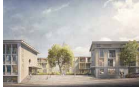
Das Korki-Areal von der Leutwilerstrasse aus gesehen.

Das ehemalige Industriegelände verändert sich fast komplett. Die Fabrikationsbauten sind struk-