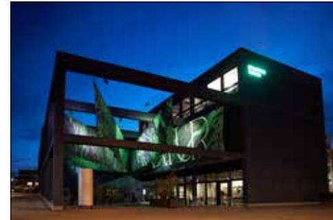
Das Stapferhaus am Bahnhof Lenzburg hat sich erneut verwandelt.

Im Stapferhaus in Lenzburg stehen die drängenden Fragen unserer Zeit im Fokus: Nach Geld, Heimat, Fake und Geschlecht widmet sich die aktuelle Ausstellung dem Thema Natur. Was oder wer ist Natur eigentlich? Wem gehört sie? Und müssen wir sie retten?