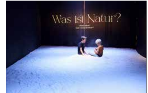
Spielerisches Entdecken der entscheidenden Frage unserer Zeit.

(Eing.) – «Natur. Und wir?» lädt zu einem poetischen Ausflug. Sie geht vom kritischen Zustand der Natur aus und führt zu einem neuen Blick auf sie. Und sie fordert dazu auf, das eigene Verhältnis zur Natur zu entdecken und mitzureden, wohin die Reise in Zukunft gehen soll.