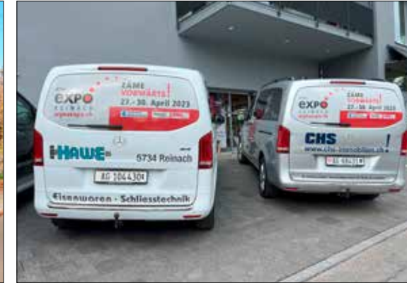
Der neueste Unimog wird an der WYNAexpo zu sehen sein. Die fahrenden Werbebotschafter (rechts) sind ab sofort unterwegs.