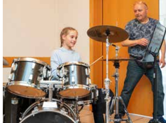
Bei der Vorstellung der Instrumente im Gemeindesaal wirkten neben dem Lehrpersonal auch Musikschüler aktiv mit.