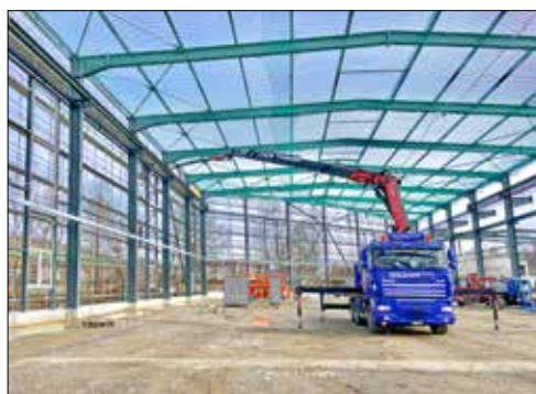
Der Kran im Einsatz bei der Kaltbandhalle in Reinach.