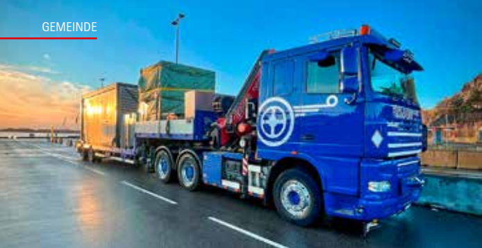
Gruss aus Norwegen: Claudio Haller mit einem Spezialcontainer-Transport für ein komplexes Rechenzentrum.