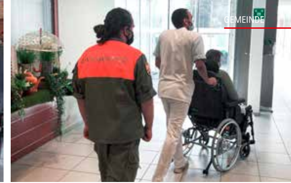
Angehörige der ZSO aargauSüd anlässlich des Feuerwehr-Grundkurses (links) und beim Einsatz in der Residenz Falkenstein.