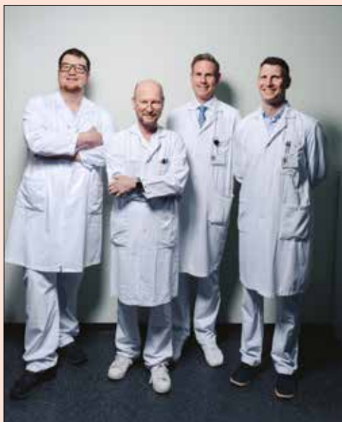
Die Ärzteschaft Chirurgie am Asana Spital Menziken.