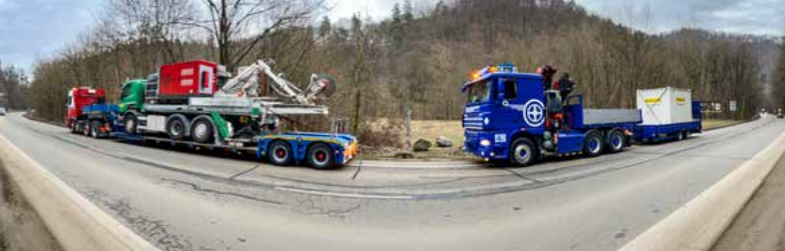
Der Schweizer Konvoi, welcher die schwere Baumaschine und den Baucontainer auf eine Baustelle nach Tschechien transportierte.