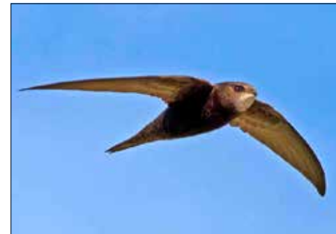
Mauersegler (Bild: Vogelwarte).

Der Natur- und Vogelschutzverein Dürrenäsch NVD erfasst im Auftrag von Birdlife Aargau ein Inventar über die Seglernistplätze, insbesondere der Mauersegler und der Mehlschwalben, damit die Brutplätze geschützt werden können.