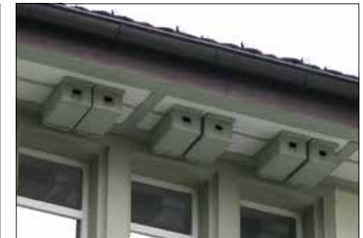
Mauerseglerkästen am Primarschulhaus Dürrenäsch.

(Eing.) – Mit der starken Bautätigkeit, der Sanierung von alten Liegenschaften oder deren Abriss, verlieren die Segler nun zunehmend ihre Brutplätze. Ihre Bestände geltend gemäss der Roten Liste der bedrohten Arten als potentiell gefährdet. Weil sie sehr ortstreu sind, kann die Zerstörung eines einzigen Gebäudes, in welchem bis dato eine Kolonie von Seglern gebrütet hat, einen markanten Verlust für eine ganz lokale Population, sogar deren Verschwinden, bedeuten.