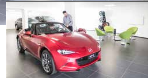
Die Fahrzeugablieferung bekommt hier eine neue Bedeutung.