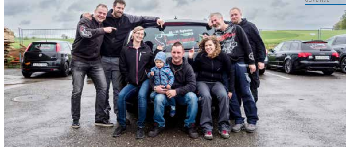
Es gibt wieder viele, welche auf die Rocknacht abfahren: Ein Teil der Rocknacht-Crew anlässlich der jährlichen Kleber-Aktion.