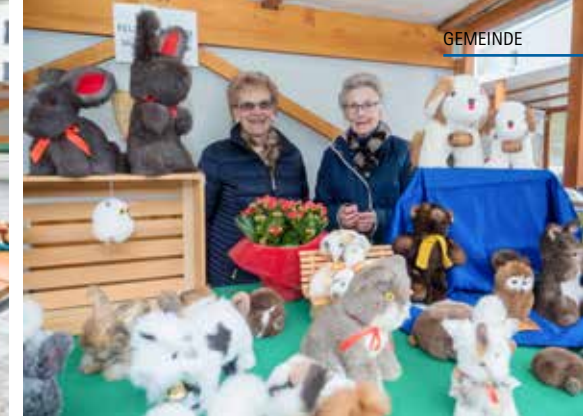
Kreativität pur bot auch die Fellnähhgruppe Meisterschwanden.