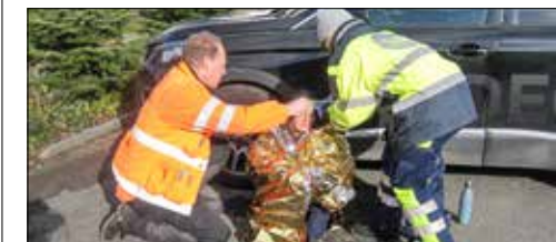
Die Suche der Hunde war erfolgreich, nach über drei Stunden konnten die Figuranten am Ziel kompetent erstversorgt werden.