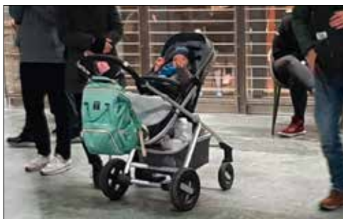
Begeisterung auch bei den jüngsten Zuhörern.