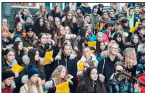
Auftritt in Luzern.

Das alljährliche Adventssingen in einer Schweizer Stadt hat an der Oberstufe in Meisterschwanden unterdessen Tradition. Dieses Mal ging es für die Schüler, Schülerinnen und begleitenden Lehrpersonen nach Luzern. So erlebten sie einen speziell stimmungsvollen letzten gemeinsamen «Schultag» vor den Weihnachtsferien.