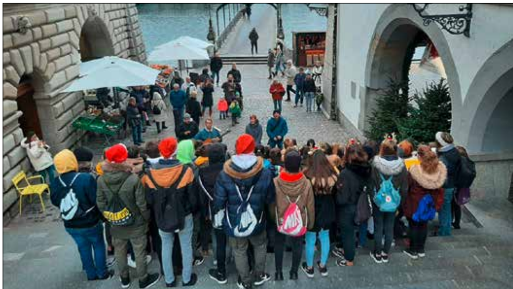
Singen erweitert den Horizont.