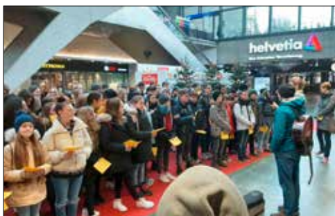
Der rote Teppich.