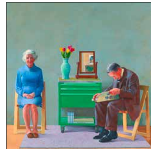
My Parents. © David Hockney.

Detaillierte Angaben zu den Kursen unter: Homepage: www.vhsag.ch/wynental E-Mail: wynental@vhsag.ch