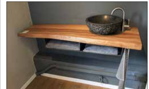
Massgefertigte Möbel für Ihr Badezimmer.