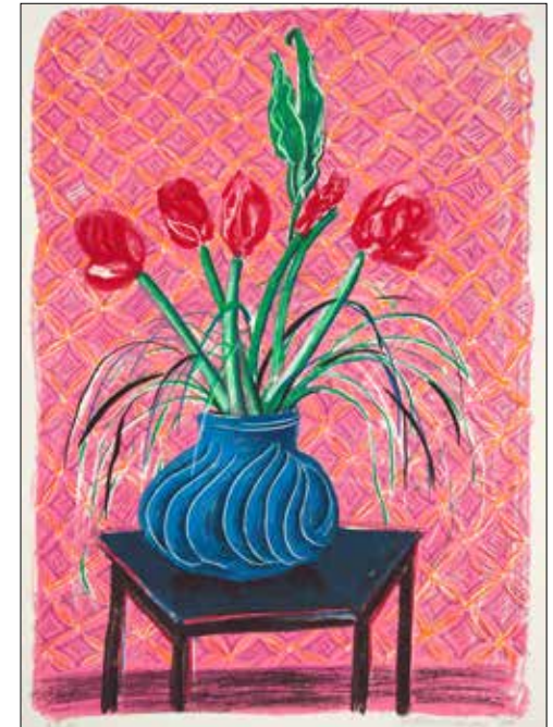
Amaryllis in Vase.

Eine Führung durch die erste umfassende Ausstellung von David Hockney in der Schweiz. Die Retrospektive im Kunstmuseum Luzern präsentiert Arbeiten von 1954 bis 2018.