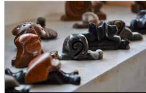
«Kunstgalerie» der Specksteinfliguren.

Auf dem Fenstersims vor Thomas' Arbeitsplatz im Kreativatelier der Stiftung Satis in Seon stehen seine «Wunsch-Männli». Das sind kunstfertig gestaltete Specksteinfliguren von unterschiedlichem Format: «Was diese Arbeiten betrifft, bin ich ehrgeizig.»