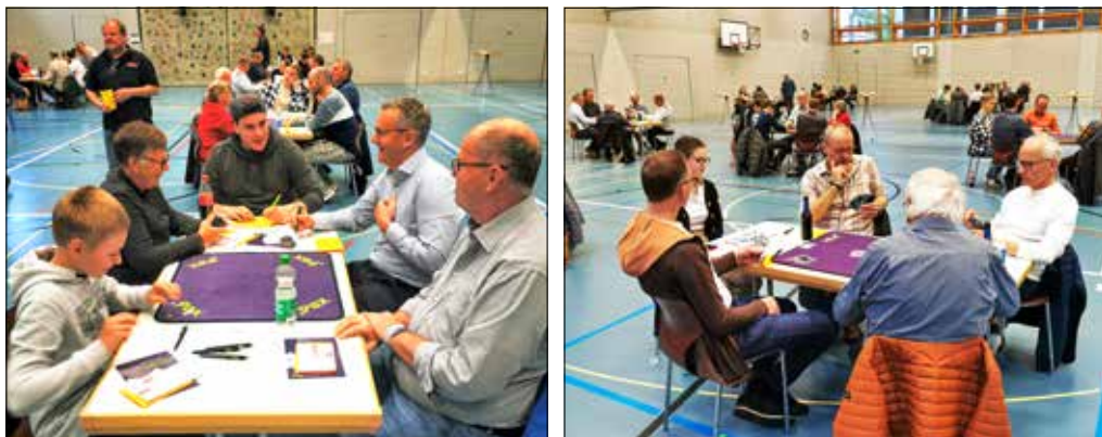
Lockere, aber konzentrierte Atmosphäre am «Donnschtig-Jass»-Qualifikationsturnier der Gemeinden Meisterschwanden und Seengen in der Doppeltturnhalle Seengen.

Seengen/Meisterschwanden: In einem gemeinsamen Qualifikationsturnier wurden jene Jasser erkoren, die im Juli ihre Gemeinde im «Donnschtig-Jass» vertreten.