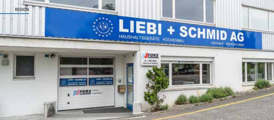
Haushaltgeräte und Küchenbau: Der Hauptsitz der Liebi + Schmid AG an der Degerfeldstrasse 9 in Schinznach-Dorf.