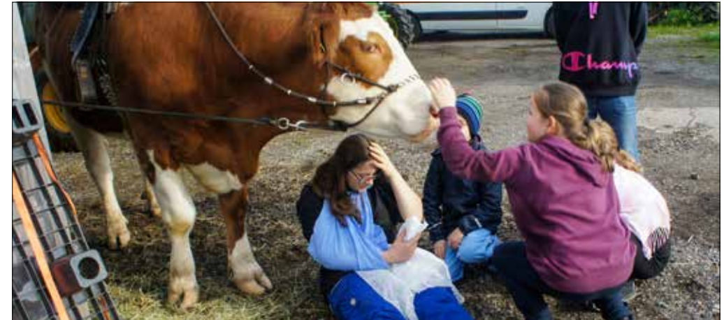
Die Help-Fox-Kinder betreuen eine vom Ochsen gestürzte Reiterin.