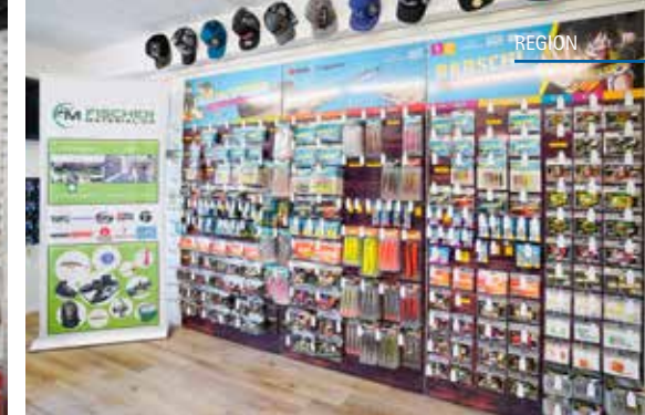
Mario Leibundgut im erweiterten Teil des Anglershops, welcher u. a. mit einer schier ungläublichen Ködervielfalt aufwartet.