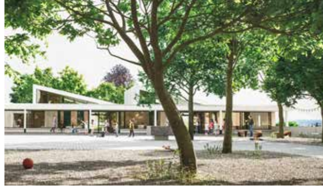
Der Verpflichtungskredit für die Projektierung Schulanlage Eggen wurde gutgeheissen. Das Thema Tempo 30 wird ebenfalls geprüft.