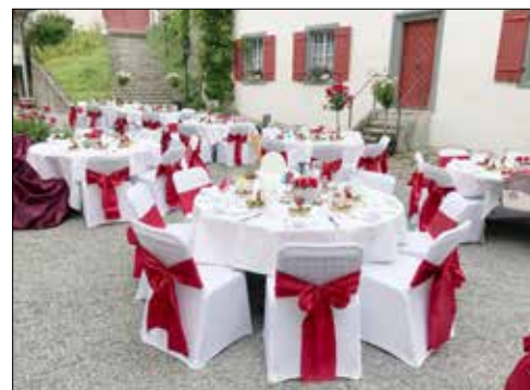
Ein «Tischlein deck dich!» mit Kuhns Handschrift.