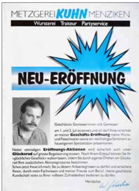
So fing alles an: Flyer für die Neueröffnung der Metzgerei.