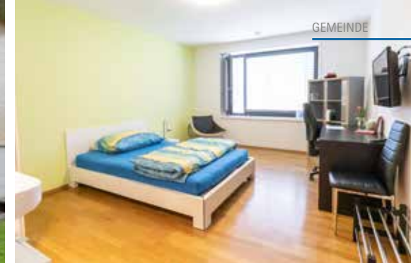
Die zwei Gebäudekomplexe mit je acht Eintrittswohnungen am Lindenweg 5 im Meisterschwanden. Rechts der Blick in eines der Zimmer.