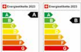
KONA Electric KONA Hybrid KONA N Line

Beispiel: KONA 1.6 GDI Hybrid Vertex*, 2WD, 104 kW (141 PS), Normverbrauch gesamt: 4.8 l/100 km, CO 2 -Ausstoss: 108 g/km, Energieeffizienz-Kat.: B. *Ab CHF 268.–/Mt. – Leasingkonditionen: Promotionspreis, Zinssatz: 0.99 % (nominal und effektiv) auf alle Modelle (ausser i20 N, i30 N, KONA N und ohne Pica*-Versionen). Dauer 36 Mt., erste (freiwillige) grosse Leasingrate 33 %, Restwerte: BAYON, i10, i20, i30, i30 Fastback, i30 Wagon, KONA, KONA EV, TUCSON, SANTA FE, NEXO, STARIA Premium: 48.3 %. IONIQ 5, IONIQ 6: 55.6 %. Fahrleistung 10 000 km pro Jahr, Vollkasko nicht inbegriffen. Die Kreditvergabe ist unzulässig, wenn sie zur Überschuldung des Konsumenten führt. Ein Angebot von Hyundai Finance. Leasinggeberin: Cembra Money Bank AG, Zürich. Gültig für Kundenvertragsabschlüsse zwischen 1.9.2023 und 31.10.2023 oder bis auf Widerruf. Änderungen vorbehalten. – **Beim Kauf eines Hyundai erhalten Sie bis zum 31.12.2023 vier passende Winterkomplettreder geschenkt (alle Modelle ohne Pica*-Versionen). – Es besteht keine Haftung für mögliche Fehler oder Auslassungen.