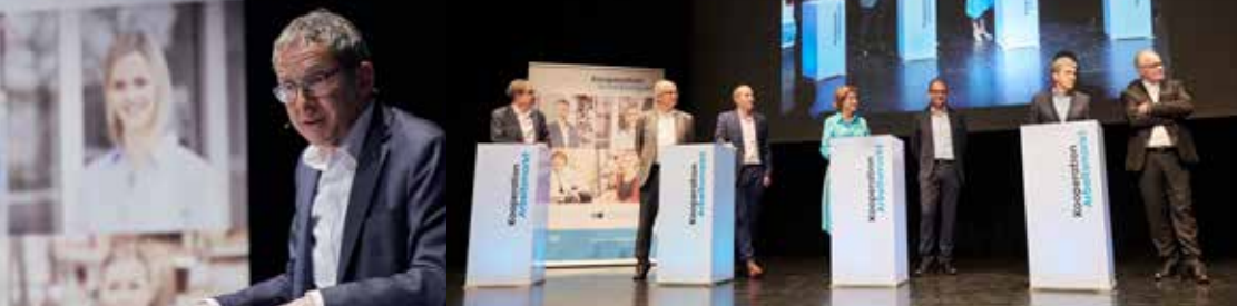
Landammann Urs Hofmann verglich die Kooperation Arbeitsmarkt mit der Kraft des Wassers der Aargauer Flüsse.