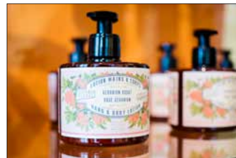
Das Geranium hat auch in der Kosmetik-Industrie Fuss gefasst.

angetreten hat, können die Besucher an verschiedenen Stationen erfahren und erleben. Nicht nur die geschichtliche Seite des Geranium ist eindrücklich. Dass es als Blickfang auf vielen Werbeträgern immer ein sicherer Wert ist, zeigt sich am Beispiel verschiedener Plakate. Und hätten Sie gewusst, dass das Geranium auch in der Küche, in der Kosmetik oder als Heilpflanze einen festen Platz hat? Blühen Sie auf einer spannenden Entdeckungsreise so richtig auf. Das Geranium aktiv erleben kann man unter anderem auch bei einem Quiz. Und: Seine Beziehung zum Geranium (positiv oder negativ) können die Besucher auf einer Karte kundtun, die sie abschliessend in einen Blumentopf stecken können. Speziell blumig wird es am 11., 12., 18. und 19. Mai. Dann führt der Gemeinnützige Frauenverein Reinach-Leimbach vor dem Schneggli einen Geranienmarkt durch. Am Sonntag, 26. Mai um 15.00 Uhr hält Drogist Martin Sommerhalder im Schneggli zudem einen interessanten Vortrag über die Heilpflanze Pelargonium.