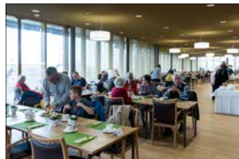
«Zmörgele» mit Verwandten und Freunden in der Cafeteria.