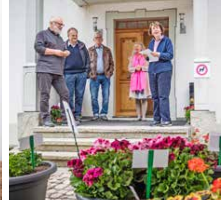
Im Museum Schneggli haben die Verantwortlichen eine interessante Ausstellung rund ums Geranium auf die Beine gestellt.