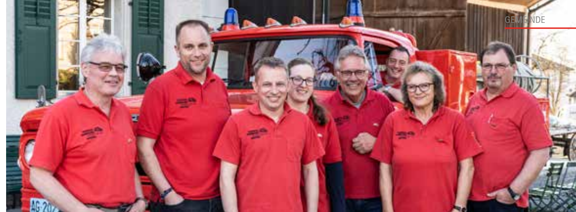
Der Vorstand bleibt in Vollbesetzung und kann alle Bereiche gemäss Organigramm abdecken.

Ihr zertifizierter VSCI-Betrieb in der Region carrosserie suisse FOR USIF VSC1