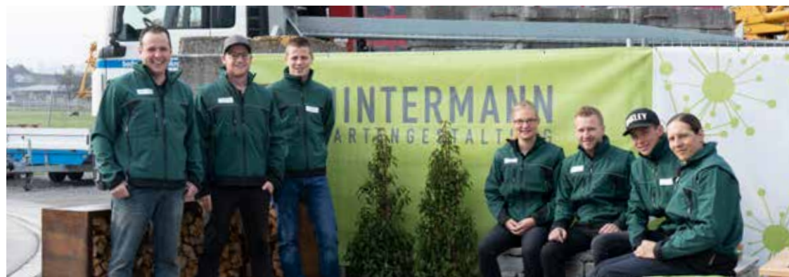
Ein junges, innovatives Team, das topp ausgebildet, maschinell sehr gut ausgerüstet ist und daher effizient jegliche Arbeiten erledigt.

räte und Maschinen inspizieren. Der Bagger war in Betrieb und wurde rege ausprobiert, während die Kinder sich auf der Feuerwehr-Hüpfburg vergnügten und hungrige Mäuler frische Pizza Margherita und Prosciutto aus dem Holzofen der Bäckerei Sollberger genossen. Während des ganzen Tages beriet das Team seine Kundschaft. So wie ein Garten wächst, bildet sich auch das Team immer weiter. Das macht die Hintermann Gartengestaltung zu einem kompetenten Partner, wenn es um Fragen und Aufgaben der grünen Branche geht.