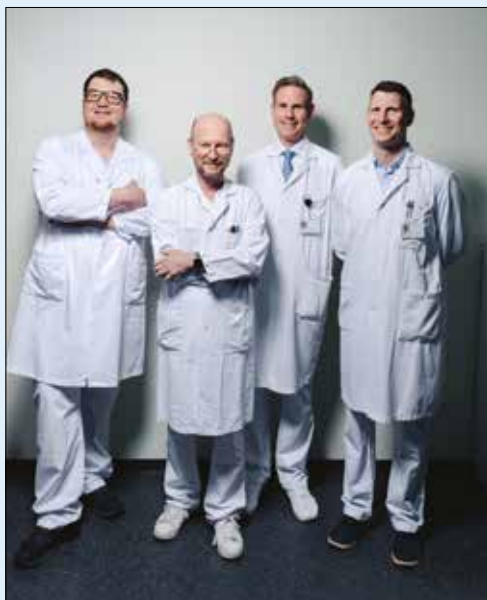
Die Ärzteschaft Chirurgie am Asana Spital Menziken.