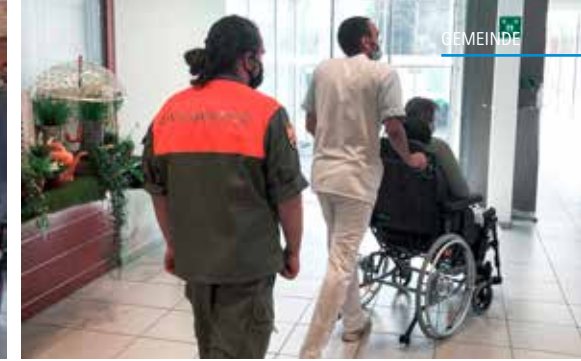
Angehörige der ZSO aargauSüd anlässlich des Feuerwehr-Grundkurses (links) und beim Einsatz in der Residenz Falkenstein.