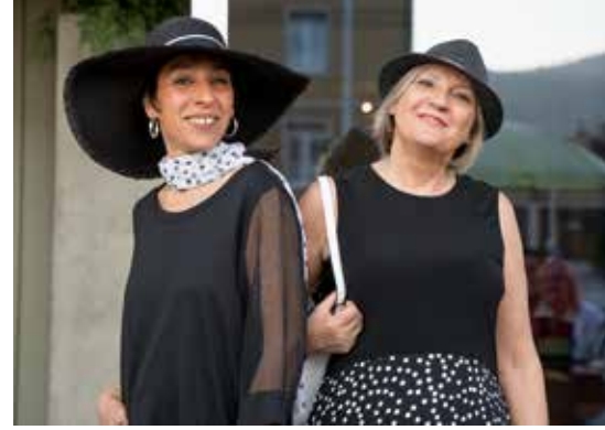
Ob Schwarz, Pastell oder knallig in Pink: Der Modesommer hat farblich viele Gesichter. Und der Hut ist mehr als nur Schattenspendener.

nr.1 fitness & lifestyle | 25 standorte | 30'000 members | 365 tage | 6-23uhr