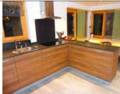
Küchenbau und Geräte-Ersatz

GANZ NACH PLAN: LEBENSQUALITÄT IN DEN EIGENEN VIER WÄNDEN.