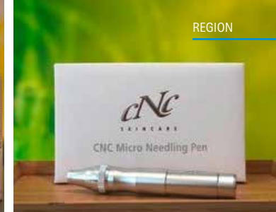
Kosmetikstudio Döbeli by Caroline Clasquin an der Böhlerstrasse 6c in Unterkulm.