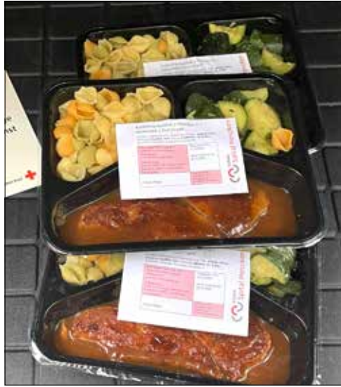
Der Fahrdienst des Aargauer Roten Kreuzes bringt vorgekochte Mahlzeiten nach Hause.

Normalerweise begleiten die freiwilligen Rotkreuz-Fahrerinnen und -Fahrer Patientinnen und Patienten zum Arzt. An zwei Tagen pro Woche liefern sie nun zusätzlich die Mahlzeiten der Spitalküche direkt nach Hause. Die Essen sind vorgekocht und können zuhause in der Mikrowelle oder