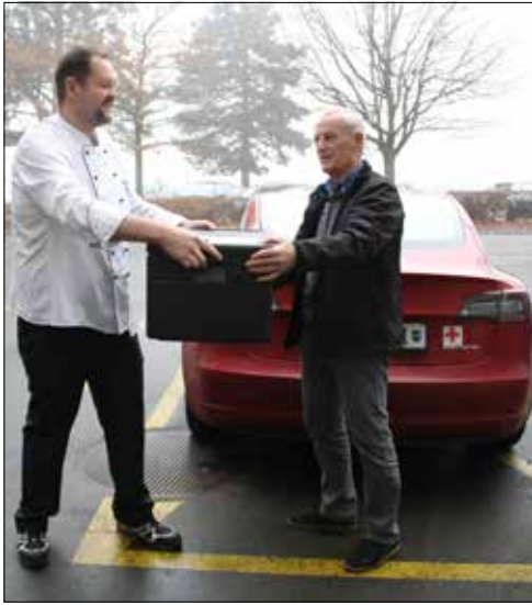
Übergabe der Essen an den Rotkreuz-Fahrer für die Auslieferung.

Das Asana Spital Menziken und das Aargauer Rote Kreuz spannen für den Mahlzeitendienst zusammen. Neu kann dank der Unterstützung des Rotkreuz-Fahrdiensts ein Lieferservice für den Mahlzeitendienst des Spitals angeboten werden.