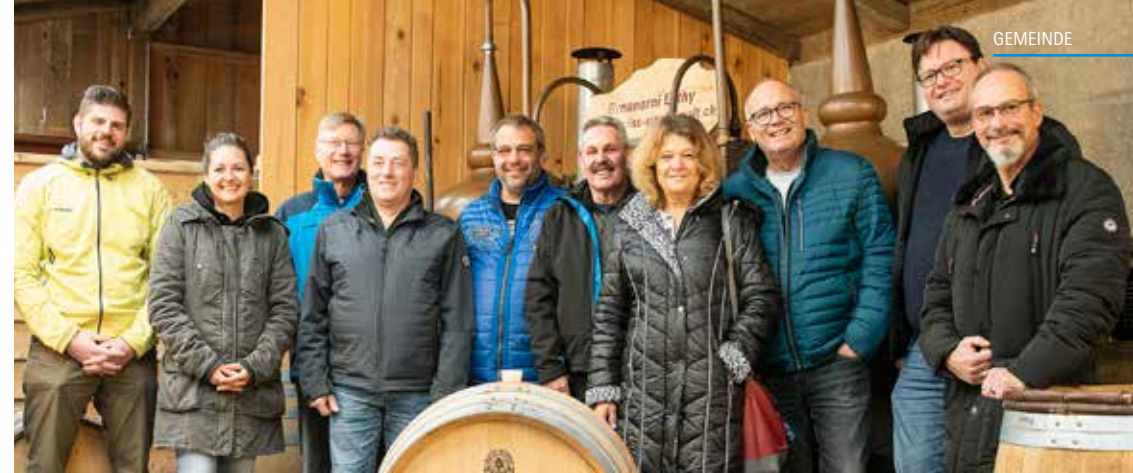
Das OK des Oberkulmer Rotkornfestes.