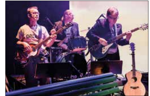
Das Theater Rigiblick lässt John Lennon aufleben.