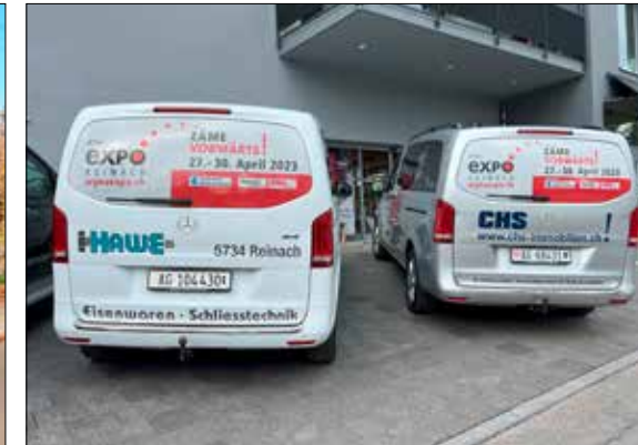
Der neueste Unimog wird an der WYNAexpo zu sehen sein. Die fahrenden Werbebotschafter (rechts) sind ab sofort unterwegs.