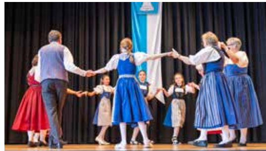
Der Vorstand an der Tagung und die Trachtengruppe Leutwil.