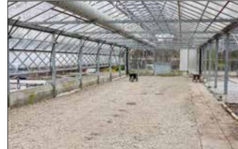
Die Gewächshäuser in Seon werden zu Verkaufsfläche umgestaltet.

Wer in Schafisheim den Standort der Gärtnerei Vogel als Privatkunde besucht, wird leider vorerst enttäuscht. Denn seit Anfang Jahr ist der Verkauf an Privatkunden dort geschlossen. Die Gärtnerei Vogel eröffnet jedoch am 19. April am nur wenige Kilometer entfernten Standort des Blumenladens in Seon die neu gestalteten Verkaufsflächen.