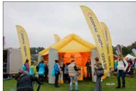
Offen für alle: Ballone und kleine Räschen gab es für die vielen Zuschauer im Post-Zelt.