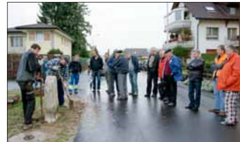
Gemeinde- und Kantonsvertreter sowie zahlreiche Interessierte wohnten der Grenzsteinsetzung bei.

Was das mit der Grenzsteinsetzung an der Ecke Pilatusstrasse/Grenzsstrasse in Reinach zu tun hat? Nun der Grenzstein, auf dem die Jahrzahl 1600 prangt, trägt auf der einen Seite das Luzerner Wappen (Pfeffikon) und auf der anderen Seite das Berner Wappen. Es erinnert an jene Zeit, als dieses Gebiet noch zum Berner Aargau gehörte. Dazu zählten die heutigen Bezirke Aarau, Brugg, Kulm, Lenzburg und Zofingen. 1803 wurde dieses politische Gebilde (Flä-