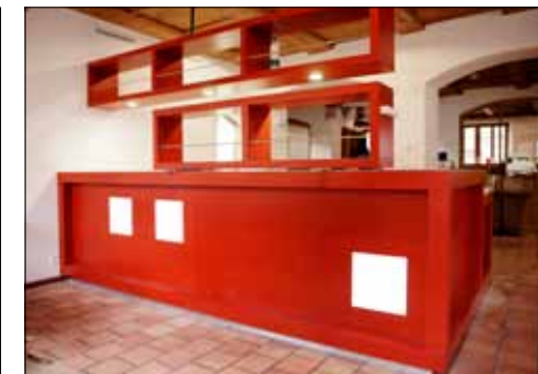
Fast fertig: die Bar als zukünftiger Treffpunkt.