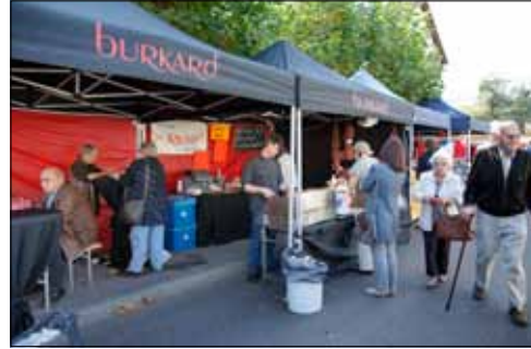
Man gönnt sich ja sonst nichts: Apfelbratwürste, Currywürste, Savelats waren heissbegehrt.

auf ein Grillbratwurst ist. Aber man ist geduldig: Schliesslich ist das Wetter schön und der Duft der Würste himmlisch. Viele Berufstätige nehmen den Markt zum Anlass, die Mittagspause hier zu verbringen. Anziehungspunkt für Kinder sind natürlich nach wie vor die Stände mit den Spielwaren. Lachende Augen sieht man hier ebenso wie weinende Gesichter. Nicht immer zufriedene Gesichter sind auch bei den Marktfahrern auszumachen. Das Geschäft läuft halt nicht immer wie geschmiert. Gute Laune versprüht aber die Truppe aus dem Bündler Landwasertal, welche die Besucher mit Häppli von frischem Bergkäse und Trockenfleisch verwöhnt. Wer weiss: Vielleicht sind sie auch am Chlausenmarkt am 1. Dezember wieder hier.