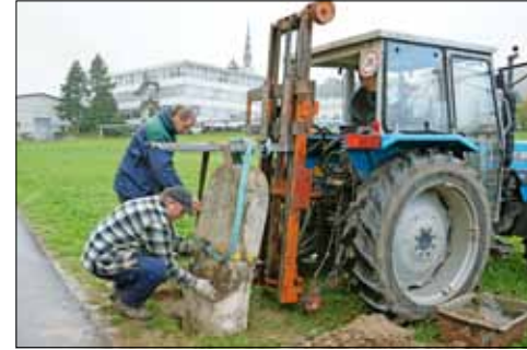
Vorsichtig wird der Grenzstein in das dafür ausgehobene Loch hinuntergelassen.

Der Bär ist im Kanton Aargau und damit auch im Oberwytental allgegenwärtig. Nein, natürlich nicht in lebender Form. Aber als Namensgeber. In Reinach zum Beispiel für das Hotel Bären oder das Einkaufszentrum Bärenmarkt.