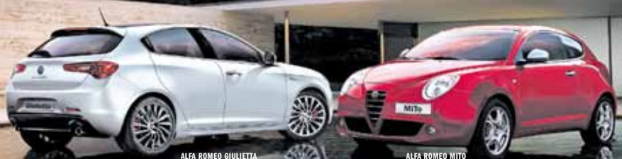
ALFA ROMEO GIULIETTA

SUPER VERSIONEN, SUPER EURO-VORTEIL: BIS ZU CHF 7500.-*