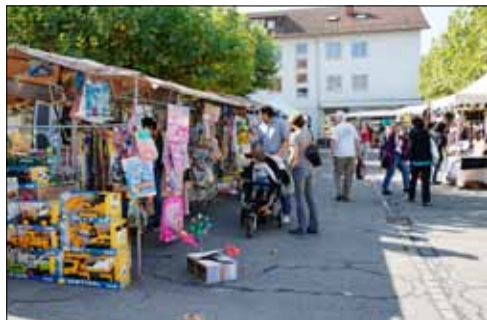
Da können die Kinder nicht widerstehen: Spielwaren sind Magnet für die kleinen Marktbesucher.

Magenbrot, gebrannte Mandeln und eine chüschtige Märtbratwurst. Schon alleine deswegen lohnt sich ein Besuch am Reinacher Warenmarkt immer. Stau gibt es beim Gasthof Bären für einmal nicht wegen des Mittags- oder Feierabendverkehrs. Vielmehr ist es die Menschenschlange, die in froher Erwartung