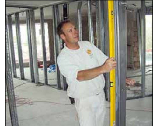
Alles im Lot: Auch im Bereich Trockenbau kann die Kölliker AG ihre Stärken voll ausspielen.

Natürlich sind 40 Jahre Firmenerfolg ein Verdienst von qualitativ hochstehender Arbeit. Hochstehende Arbeit erfordert aber auch hochwertige Produkte. «Hier können wir auf viele Lieferanten zählen, mit