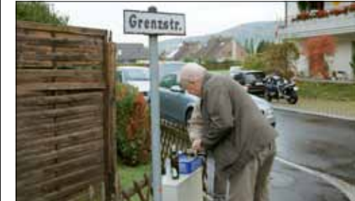
Jedem einen kühlen Schluck Weisswein: An der Grenzstrasse wird der Apéro vorbereitet.