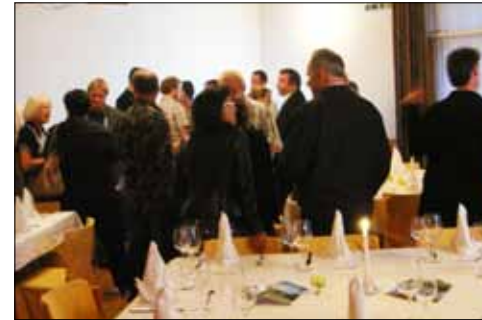
Wie immer war der Herbsthock ein gut besuchter HAGO-Anlass

Jedes Jahr lädt der HAGO Gewerbe Oberwental seine Mitglieder zum traditionellen Herbsthock ein. Der beliebte Anlass erfreute sich auch in diesem Herbst an einer grossen Besucherschar.