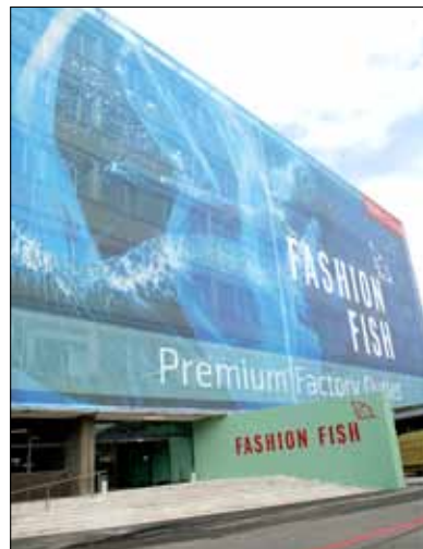
Hier wird das Shoppen zum Erlebnis: Premium Factory Outlet Fashion Fish.

*Die Ermässigungen für die Tipp-Angebote erhalten Sie an Ihrem Ausflugsziel gegen Vorweisen des entsprechenden Gutscheines aus der Broschüre zusammen mit einem gültigen Bahnbillet. Die ermässigten Kombi-Angebote kaufen Sie an Ihrem Bahnhof. Die Angebote sind gültig vom 1. November 2011 bis 31. März 2012.