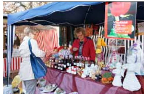
Eigenproduktionen: Sirup, Konfitüre und Dekoartikel finden bei der Käuferschaft immer Anklang.

auf ein Grillbratwurst ist. Aber man ist geduldig: Schliesslich ist das Wetter schön und der Duft der Würste himmlisch. Viele Berufstätige nehmen den Markt zum Anlass, die Mittagspause hier zu verbringen. Anziehungspunkt für Kinder sind natürlich nach wie vor die Stände mit den Spielwaren. Lachende Augen sieht man hier ebenso wie weinende Gesichter. Nicht immer zufriedene Gesichter sind auch bei den Marktfahrern auszumachen. Das Geschäft läuft halt nicht immer wie geschmiert. Gute Laune versprüht aber die Truppe aus dem Bündler Landwasertal, welche die Besucher mit Häppli von frischem Bergkäse und Trockenfleisch verwöhnt. Wer weiss: Vielleicht sind sie auch am Chlausenmarkt am 1. Dezember wieder hier.