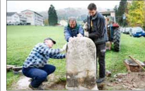
Viele Hände waren gefragt: Mit vereinten Kräften wird der Grenzstein ins Lot gebracht.

che ca. 600 km 2 ) definitiv aufgelöst und dem neugegründeten Kanton Aargau zugeordnet. Geblieben ist der Grenzstein (einer von 200 noch bestehenden aus der Bernerzeit im Aargau), der im Beisein von Gemeinde- und Kantonsvertretern und zahlreichen Schaulustigen neu gesetzt wurde. Dies nachdem er wegen Kanalisationsarbeiten temporär an einen sicheren Ort gebracht wurde. Seine Funktion als eigentlicher Grenzpunkt kann der Stein, der auf Pfeffiker Gemeindegebiet steht, aus verkehrstechnischen Gründen allerdings nicht mehr wahrnehmen.