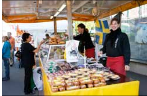
Möchten Sie versuchen? Bergkäse, Trockenfleisch, Birnenbrot etc. gabs aus dem Bündnerland.

Der billige Jakob ist am Reinacher Markt längst nicht mehr anzutreffen. An Anziehungskraft hat der Warenmarkt rund um das Reinacher Gemeindehaus dadurch aber nichts eingebüsst. Auch der Herbstmarkt im Oktober war einmal mehr ein bunter Treffpunkt von Marktfahrern aus der ganzen Schweiz und Besuchern aus nah und fern.