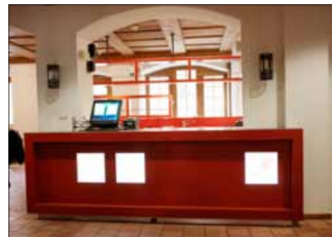
Ebenfalls in Rot gehalten: Office mit Kasseneinheit.

Wenn die Gäste im neueröffneten Gasthaus zum Schneggen Rot sehen, ist das in keinsten Weise mit einem negativen Touch in Verbindung zu bringen. Ganz im Gegenteil: Rot sind nämlich die neugestaltete Rezeption im Eingangsbereich und die Bar in der Gaststube. Sie sind die optischen Blickfänge, welche im Zuge einer Modernisierung dem Schneggen ein neues Gesicht geben und der Gaststube einen positiven Farbtupfer verleihen.