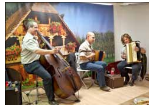
Im Örgeli-Spycher geht die Post jeden Samstagabend ab. Hier mit dem Trio Rötstock, Siebnen.