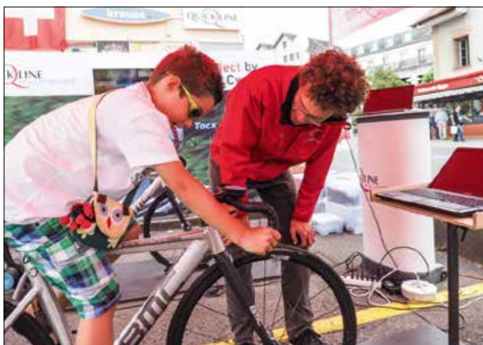
Leute von Swiss Cycling gaben Anweisungen ...

Man muss nicht von der Rolle sein, um mit Fabian Cancellara um die Wette zu fahren. Ganz im Gegenteil: Der Quicklineshop an der Hauptstrasse 55 in Reinach und Swiss Cycling luden am Jugendfest-Samstag zum Rollensprint ein, wo man auf der virtuellen Rennbahn kräftig in die Pedalen treten konnte und zusätzlich mit Wurst, Brot und Getränken verköstigt wurde.