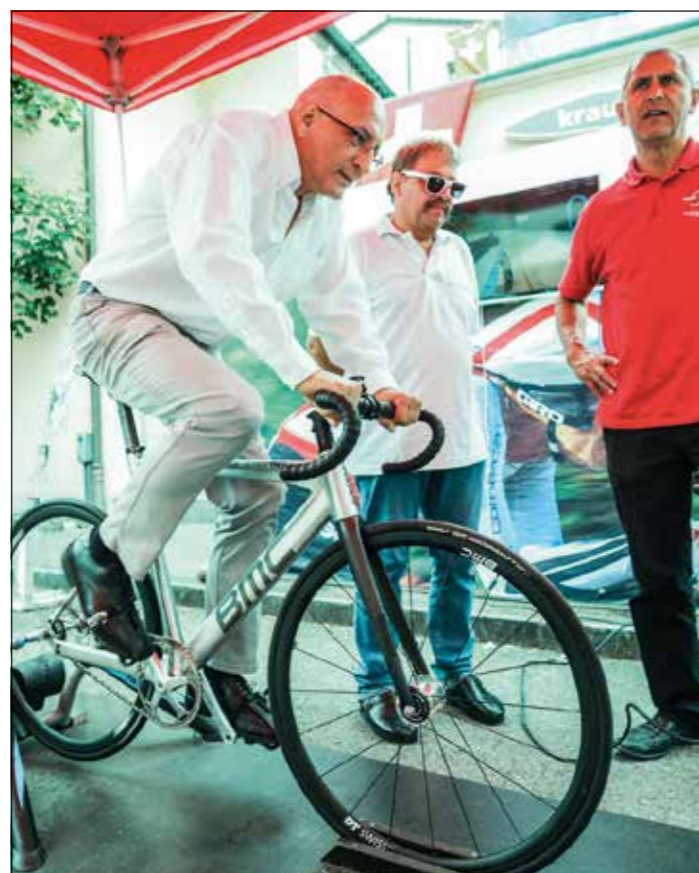
Das Jugendfesttenuer war kein Grund, sich am Kilometer-Rollentest nicht auf den Sattel zu schwingen.

auch die zurückgelegte Strecke und die gefahrene Zeit eingeblendet. Die besten Fahrerinnen und Fahrer der verschiedenen Kategorien werden im November ins Velodrom Suisse nach Grenchen eingeladen, wo sie unter Anleitung von Radprofis die verschiedenen Radsportarten kennenlernen dürfen. Die aktuellen Ranglisten findet man unter www.rollensprint.ch