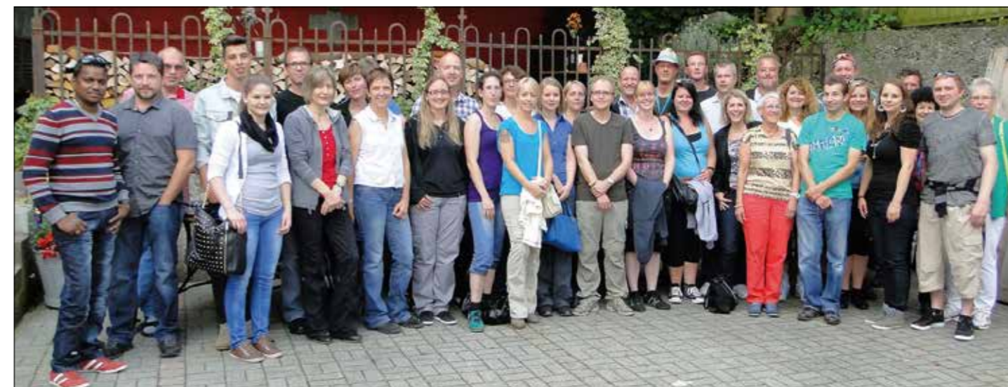
Kompetente Grossfamilie: Die Belegschaft der Marzohl Werbetechnik AG anlässlich eines Firmenausfluges.

Informationen: www.aargausued.ch , www.seetaltourismus.ch