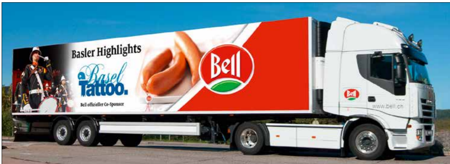
Hier gehts um die Wurst und um das «Basel Tattoo»: LKW-Beklebung für Bell, made by Marzohl.

re nach der Firmengründung konnte das ehemalige Postgebäude an der Hauptstrasse 47 in Menziken gekauft und bezogen werden. Nicht nur das markante Türmli bot äusserlich einen optischen Blickfang. Es waren vielmehr die Arbeiten, welche die Menziker Schriftenmalerei verliessen. Sie sorgten an Fahrzeugen, Hausfassaden und Schaufenstern etc. landauf, landab für optische Hingucker.