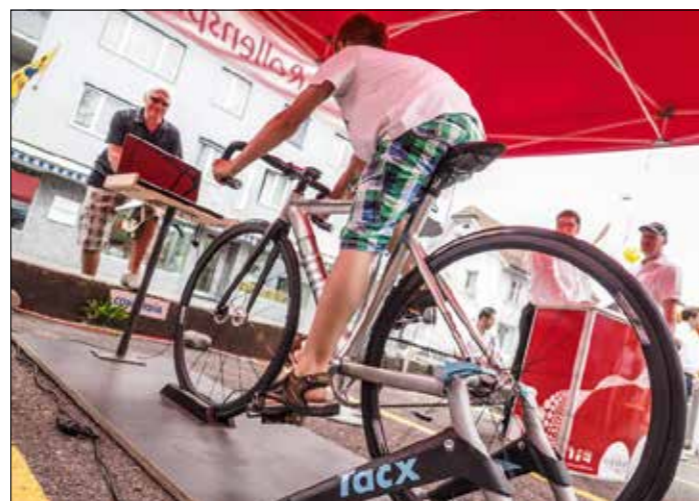
... bevor kräftig in die Pedalen getreten wurde.

Mitmachen kam auch in Reinach vor gewinnen: Ziel dieses Rollensprints ist auf der einen Seite zwar die Talentsichtung, auf der anderen Seite soll aber speziell die Begeisterung für den Radsport geweckt werden. Bisher wurden an verschiedenen Orten in der Schweiz zu diesem Zweck Bahnvelos aufgebaut, mit welchen man den traditionellen Kilometerstest auf der virtuellen, 1200 Meter langen Radrennbahn mit dem Rollentrainer absolvieren konnte. Dass dieses Bahnrennen mit Velos ohne Übersetzung ganz schön in die Wädli und Oberschenkel gehen kann, mussten viele der Teilnehmer erfahren. Dass die meisten dabei auch ganz schön ausser Atem kamen, war unübersehbar. Gut deshalb, wer über eine solide Grundkondition sowie über Schnellkraft verfügte. Aber auch hier galt in erster Linie: Mitmachen kommt vor gewinnen. Seine Fahrt konnte man übrigens auf einem Monitor live miterleben. Dort wurden