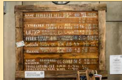
Verschiedene Biersorten aus der Region stehen zur Auswahl.

wo das Mälzen, das Maischen und die Gärung die drei wichtigsten Schritte bilden. Im Anschluss an den informativen Theorieteil im Versammlungsraum ging es zur Besichtigung der Mikro-Brauerei, welche sich im Gästelokal im Erdgeschoss befindet. Mit dem 300 Liter grossen 2-Geräte-Kombisudhaus stellt Züger pro Sud 600 Liter naturbelassenes Rynecher Bier her, welches während vier bis fünf Wochen im Tank gärt und dann frisch vom Hahnen gezapft wird. Aus der 8-Zapfhahnen-Anlage konnte man auch noch weitere sieben individuelle Biersorten aus der Region kosten.