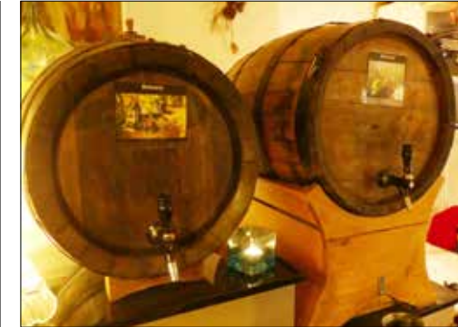
Cabernet Sauvignon und Chardonnay vom Fass.