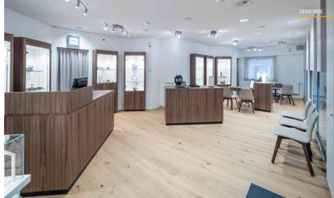
Das Verkaufslokal erstrahlt mit dem Eichenparkettboden, den Nussbaummöbeln und der neuen Beleuchtung in neuem Glanz.