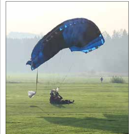
Nach kurzer Zeit und viel Adrenalin wieder sicher gelandet.

essierte Jugendliche dürfen sich gerne bei uns für eine Schnupperlehre melden, wir sind laufend auf der Suche nach jungen Gartenbautalenten.