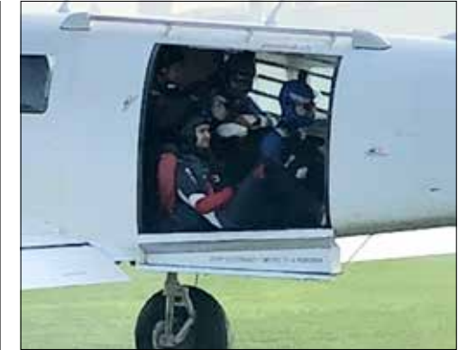
Die Maschine ist bereit zum Start, das Wetter perfekt.

(Eing.) – Nach der ausführlichen Instruktion gings auf einen Flug mit herrlicher Aussicht auf den Vierwaldstättersee, den Pilatus und die Alpen. Auf einer Höhe von rund 4000 Metern mussten/durften sich die drei sicher festgehackt an ihren Tandemmastern mit ca. 200 km/h im freien Fall in die Tiefe stürzen. Einige Minuten später war das Erlebnis vorbei und die drei landeten mit leuchtenden Augen wieder auf dem Flugplatz in Beromünster.