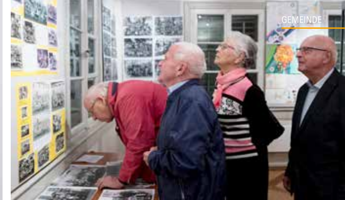
Die Suche nach sich selbst, nach Schulkollegen und Bekannten ist gross.