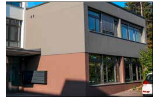
Showroom und Laden an der Luzernerstrasse 24 in Beinwil am See.

zu unterscheiden ist. Das erfolgreiche Unternehmen konnte bereits expandieren und so werden die Bäume und künstlichen Pflanzen mittlerweile auch in Österreich verkauft. Der Showroom und Verkaufsladen ist von Montag bis Samstag von 9.00 bis 12.00 Uhr geöffnet. Die grosse Auswahl an künstlichen Pflanzen, Zubehör und Tannenbäumen ist auch online unter greendeco.ch jederzeit bestellbar und wird bequem nach Hause geliefert.