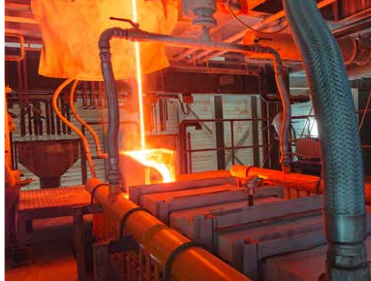
Der Glasstrahl kommt aus dem Ofen.