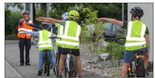
Für jeden Fahrradfahrer im Strassenverkehr etwas vom Wichtigsten: Klare und deutliche Handzeichen geben.