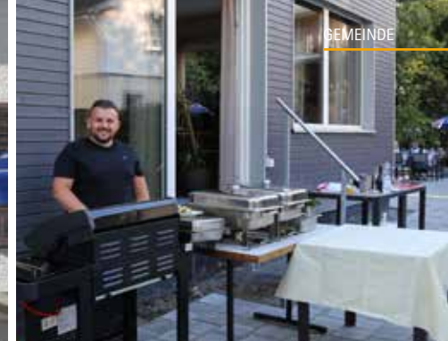
Zur Einweihung der neuen Gartenterrasse gabs frische Grilladen.