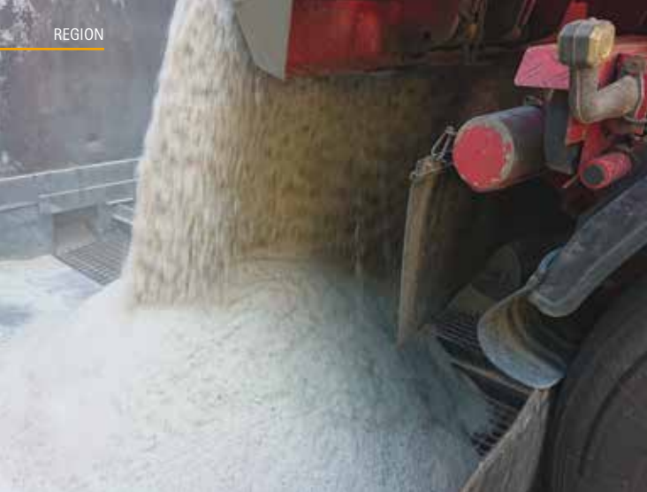
Das rezylierte Glas wird angeliefert.