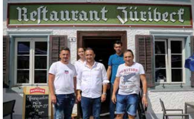
Die familiäre Atmosphäre mit den Mitarbeitern sowie mit den Gästen hat beim Züribeck-Team hohe Priorität.

Gontenschwilerstrasse 3 | 5727 Oberkulm Telefon 062 776 32 37 | Telefax 062 776 39 31 info@r-steiner-oberkulm.ch | www.r-steiner-oberkulm.ch