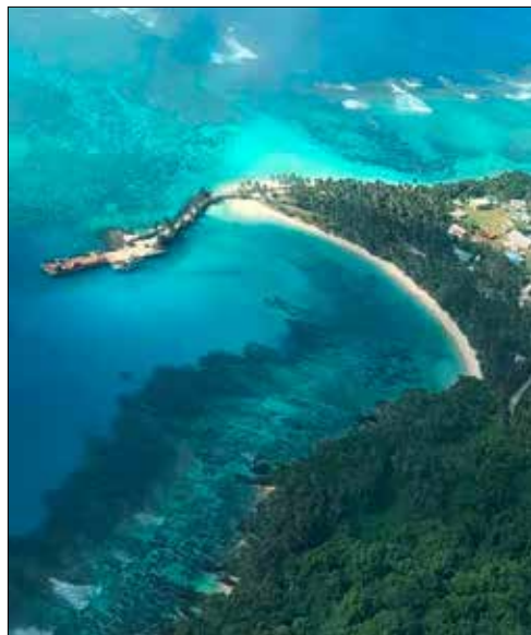
Rotuma Island ist eine Gruppe von neun bewaldeten vulkanischen Inseln im Südwestpazifik.

Die Ehefrau Fuata von Markus Herzog ist auf Rotuma, im äussersten Norden des Staatsgebiets Fidschi aufgewachsen. Rotuma Island ist eine Gruppe von neun bewaldeten vulkanischen Inseln im Südwestpazifik. Die Hauptinsel ist 13 Kilometer lang und 4 Kilometer breit. Insgesamt gehören zur Republik Fidschi 332 Inseln mit einer Gesamtfläche von 18'333 km 2 , von denen 110 bewohnt sind.