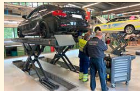
Experten der Verkehrstechnik bei der technischen Kontrolle.

Auto-Poser, die mit leistungsstarken und oft unzulässig getunten Autos Runden drehen, sorgen für erhebliche Lärmbelastigungen. Dieses unnötige Verhalten wird zum schwer zu ertragenden Ärgernis der Bevölkerung und führt regelmässig zu Beschwerden bei den Behörden.