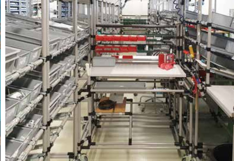
Die Banderoliermaschinen werden in Meisterschwanden hergestellt.