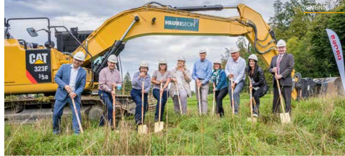
Vertreter des Altersheims, des Stiftungsrates, des Architekturbüros und des Generalunternehmens beim Spatenstich.

Garage Brun Reinach Carrosserie+Autospritzwerk www.garagebrun.ch