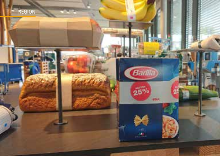
Das berühmte Band um die Lebensmittel aus Meisterschwanden.