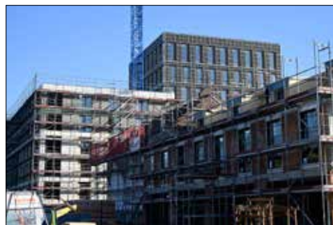
Neubau, Überbauung KWC Unterkulm.