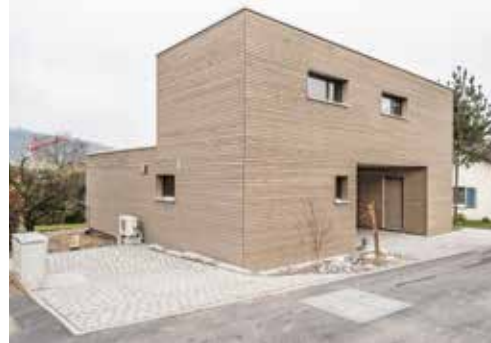
Zweigeschossiges Modulhaus, Menziken.