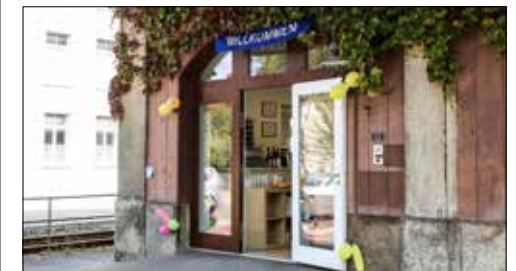
Das A.P Beauty- und Nagelstudio an der Luzernerstrasse 12.