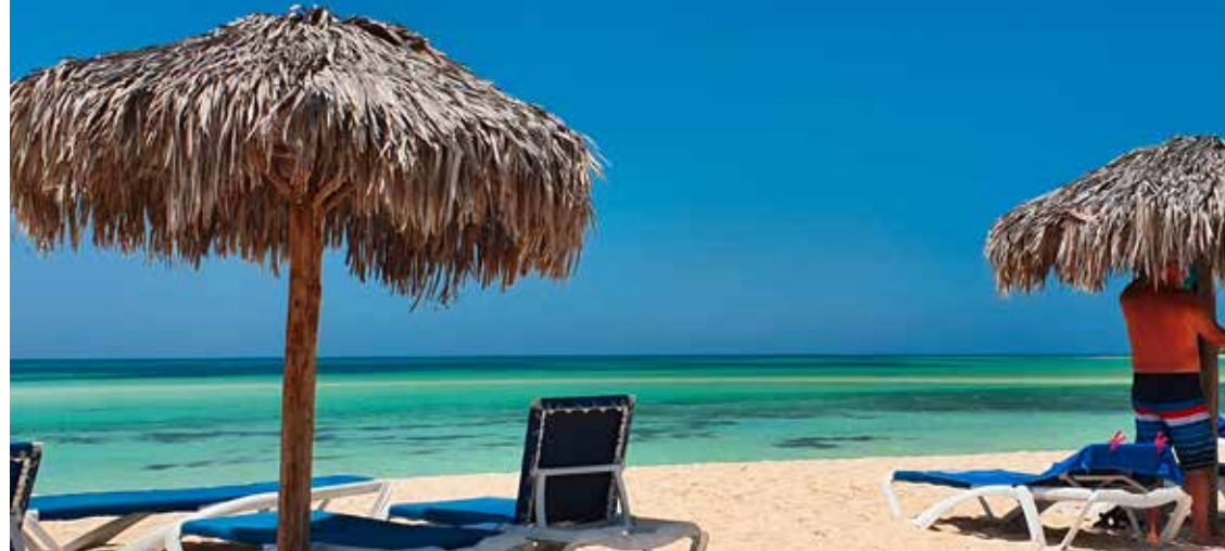
Traumhafte Sandstrände in Kuba.

In Kuba herrscht ein tropisches Klima mit einer trockenen Jahreszeit vom November bis April und einer regnerischen von Mai bis Oktober. Kuba liegt aber auch im Einzugsgebiet von tropischen Wirbelstürmen, die sich von Juni bis November über