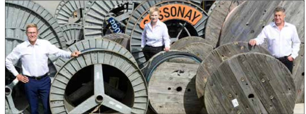
Die Geschäftsleitung der EWS Energie AG freut sich über reduzierte Strompreise 2021 für Haushaltkunden.

Haushalt-Kundinnen und -Kunden des regionalen Versorgungsunternehmens EWS Energie AG bezahlen nächstes Jahr über 3 Prozent weniger für ihren Strom. Solarstrom-Produzenten, die Solarstrom ins Netz einspeisen, erhalten für den Herkunftsnachweis 3 Rp./kWh zusätzlich zur Stromvergütung.