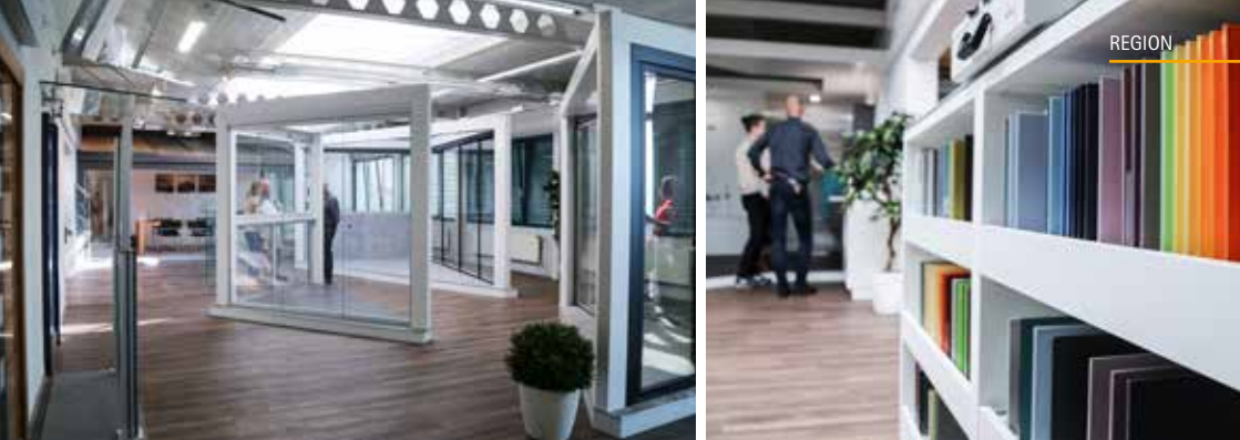
Die Herbstausgabe der Hausmesse war ein voller Erfolg für die Haerry & Frey AG in Beinwil am See.