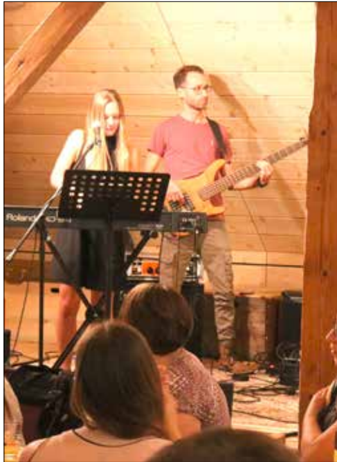
SilverBlue sorgte für gute Stimmung an der Jubiläums-GV des SV Volley Wyna.