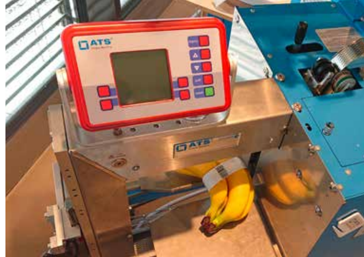
Von Standard bis individuell: Verpackungsmaschinen von Tanner & Co. AG.