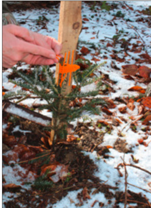
Kleine Klammer mit grosser Wirkung: So sieht ein Verbiss-Schutz aus.