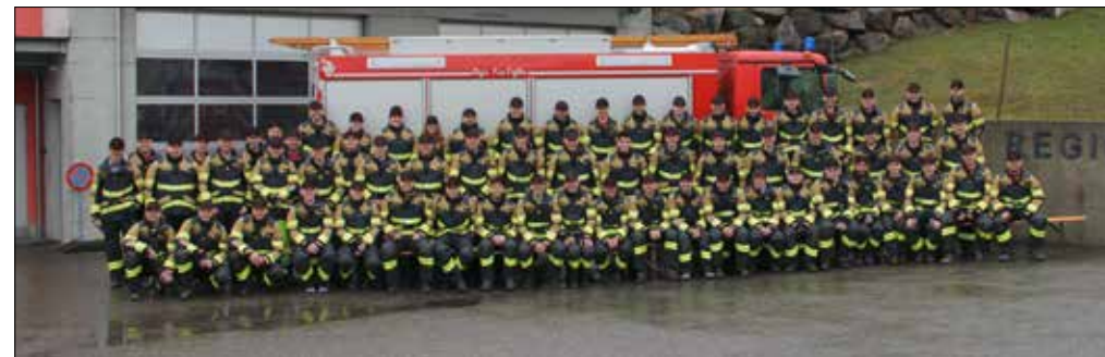
Die ganze Mannschaft der RegioWehr Aesch sagt nochmals Danke für die tolle Zusammenarbeit

Traditionellerweise werden die abtretenden Feuerwehringeteilten an der Agathafeier in einem würdigen Rahmen geehrt. Leider mussten wir diese auch für 2021 aus bekannten Gründen absagen. Darum möchten wir diese Ehrungen nun auf diese Weise vornehmen.