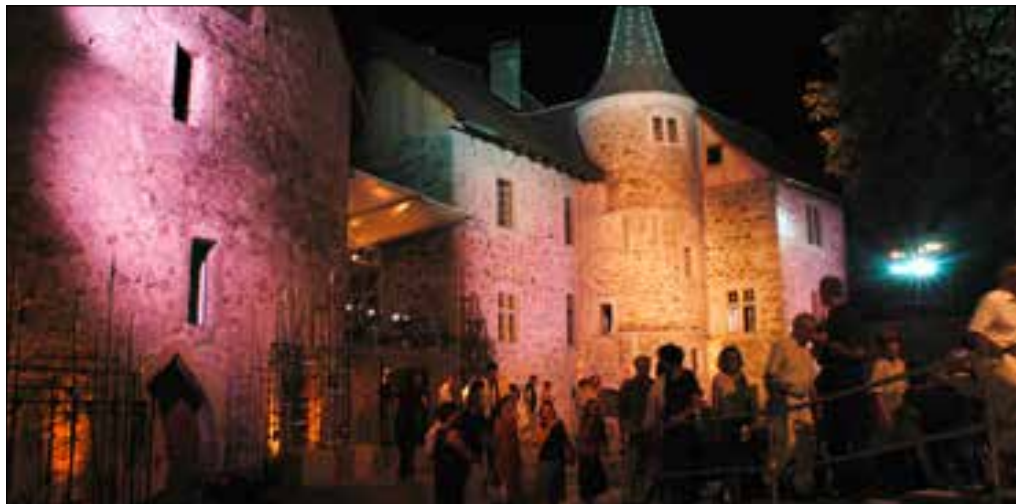
Das Wasserschloss Hallwyl ist die perfekte Kulisse für «Il Barbiere di Siviglia».

Das Wasserschloss Hallwyl bildet die Kulisse für einen einzigartigen sommerlichen Operngenuss. Am 27. Juli feiert «Il Barbiere di Siviglia» Premiere. Bewusst setzt die Oper Schloss Hallwyl auf junge Sängerinnen und Sänger. Wer sie sehen und hören möchte, ist gut bedient, rasch Tickets zu kaufen.