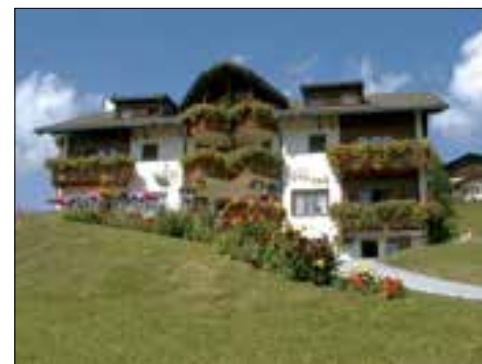
Bietet allen Komfort: das 3-Stern-Hotel Gravas.

In dieser einzigartigen Umgebung wurde 1984 das 3-Stern-Hotel «Gravas» gebaut. Mit seinen 15 Zimmern, alle mit Dusche/WC, wird es noch heute als Familienbetrieb geführt. Die vielen langjährigen Stammgäste geben dem Leitspruch der Gastgeber recht. Im Hotel Gravas in Vella wohnen Sie mit allem Komfort. Stärken