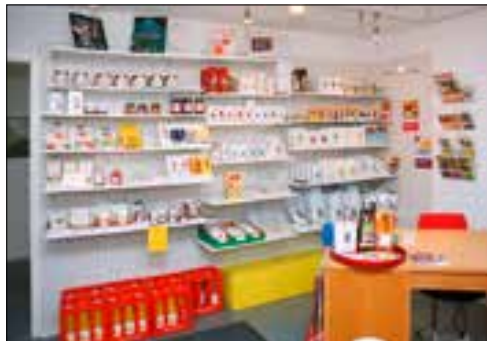
Ein Teil des vielfältigen Lebensmittel-Angebotes.

Die Fairehandelsbewegung existiert seit rund 40 Jahren. Sie konzentriert sich hauptsächlich auf Waren (landwirtschaftliche Produkte und traditionelles Handwerk) aus Entwicklungsländern. Mit einem von Fairtrade-Organisationen festgelegten Mindestpreis soll den Produzenten ein höheres, gerechteres und verlässlicheres Einkommen als im herkömmlichen Handel ermöglicht werden und so für eine gerechtere Welt sorgen. «Die Max-Havelaar-Stiftung Schweiz – bekannt für das Fairtrade-Gütesiegel – feiert in diesem Jahr bereits ihren 20. Geburtstag», wie Tobias