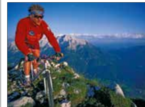
Biketouren werden mit schönen Aussichten belohnt.

Gleichzeitig ist das Hotel auch Ausgangspunkt für unzählige Touren auf einem umfangreichen Wanderwegnetz. Natürlich finden auch Walker ein wahres Paradies für ihre sportliche Betätigung vor. Das Val Lumnezia lässt sich aber auch sehr gut mit dem Bike erkunden und geniessen. Abwechslungsreiche Touren mit verschiedenen Anforderungsprofilen stehen dabei zur Auswahl. Von leichten Touren mit der Familie oder Freunden bis hin zu anspruchsvollen Singletrails bietet das Val Lumnezia für alle Biker etwas. Fahrten über flache Alpweiden, vorbei an sprudelnden Bergbächen sind ebenso faszinierend wie anspruchsvollen Aufstiege und anschliessenden Abfahrten. Entscheidend ist: Hier sind Sie am Pulse der Natur. Erleben Sie bei uns die einmalige Bergwelt! Infos unter www.hotelgravas.ch