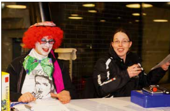
Ruhe vor dem Sturm: das Kassenpersonal.

«Heu obenabe, jetzt gämmer Vollgas!» Unter diesem Motto stand die Fasnacht 2013 der Guggenmusik Sompfguuger. Die närrische Zeit liess sie allerdings nicht verstreichen, ohne das rauschende Sompfguuger-Fest in der neuen Mehrzweckhalle steigen zu lassen. Und auch hier war Vollgas noch einmal speziell Programm.