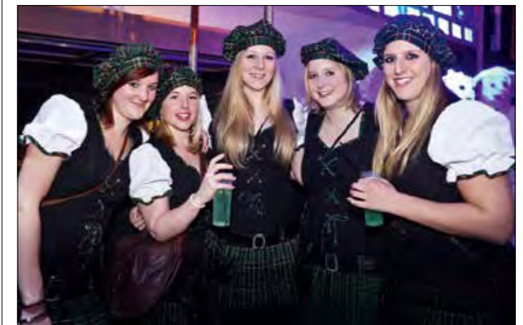
Sie gaben sich schottisch aber nicht kleinkariert.