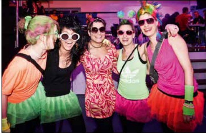
Die Flowerpower-Truppe sorgte für gute Laune.