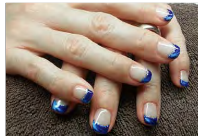
Vieles ist möglich, was die Fingernägel betrifft.

Um dem Wellness-Erlebnis die Krone aufzusetzen, kann man im Nailstudio von Jeanine Oester in die faszinierende Welt der schönen und gepflegten Nägel eintauchen. «Schöne Nägel für meine Kundschaft sind meine Passion», sagt Jeanine Oester. Auch ihr ist es wichtig, auf die Wünsche und Bedürfnisse der Kundinnen einzugehen – sie kompetent zu beraten