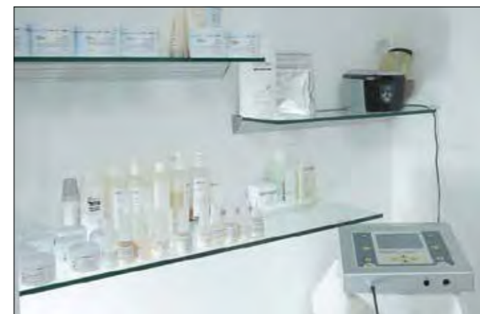
Auch Pflegeprodukte sind erhältlich.

die Sommer- und Badesaison ist speziell bei den Damen auch die Haarentfernung ein Thema. Bei Susanna Hagmann gelangt das Wachsprinzip zur Anwendung. Grosser Beliebtheit erfreut sich der Wellness-Halbtage, der ca. 5 Stunden dauert und Körperpeeling, Körperpackung, Rücken- und Nackenmassage, Fusspflege, klassische Gesichtsbehandlung, Manicure, Super-Chi-Swing und einen Imbiss beinhaltet.