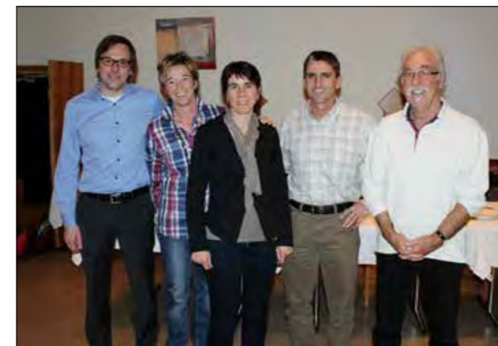
Neuer Vorstand 2013.