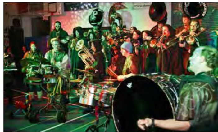
Die Bünzgeischer bei ihrem lautstarken Auftritt.