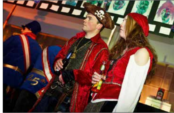
Noch etwas skeptisch: der Pirat mit Begleitung.