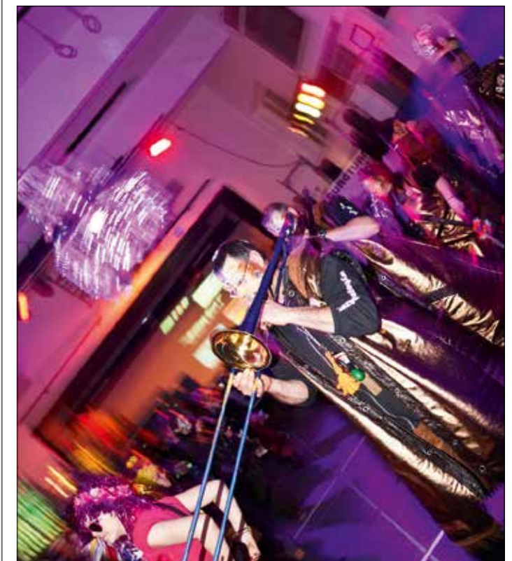
Die Wyberg-Schränzer Aarau verlassen das Parket.