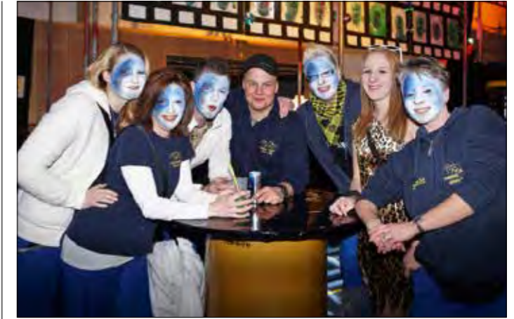
Moräneschränzer-Delegation aus Gontenschwil.