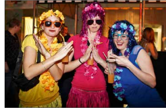
In Festlaune: Miss Yellow, Miss Pink und Miss Blue.