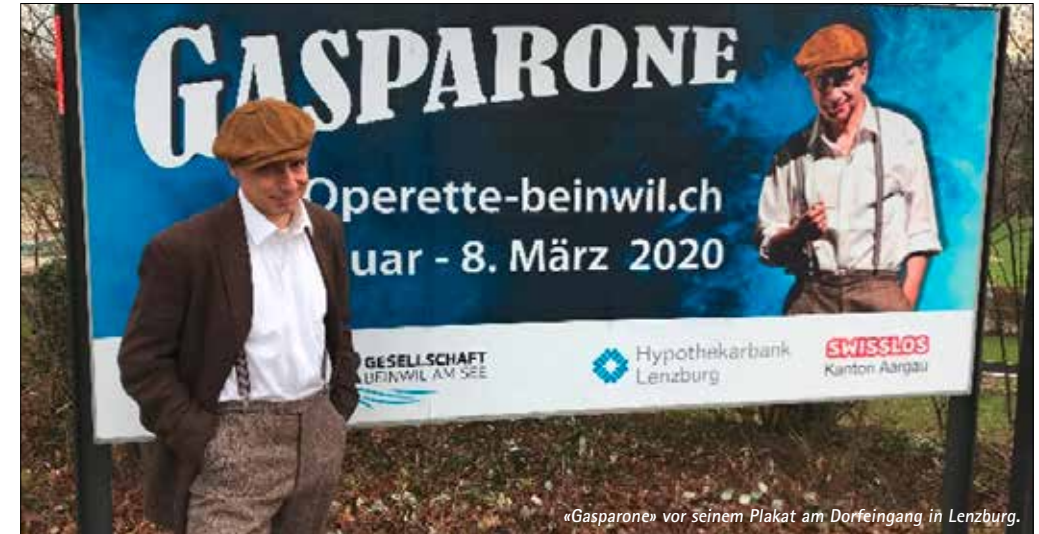
«Gasparone» vor seinem Plakat am Dorfeingang in Lenzburg.