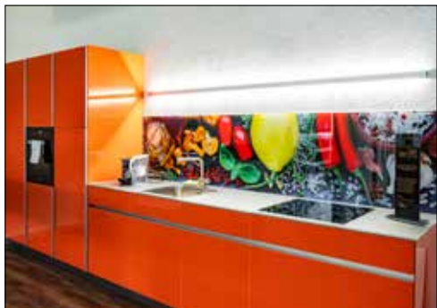
Küchenrückwände als individuelle Designobjekte.

Die Haerry & Frey AG lädt zur diesjährigen Hausmesse ein, bei der Besucher die neuesten Trends und Entwicklungen in der Glasgestaltung entdecken können. Ob im Innen- oder Aussenbereich – hautnah kann erlebt werden, wie vielseitig und kreativ Glas eingesetzt werden kann.