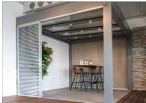
Schier unendliche Möglichkeiten werden angeboten.

(dah) – Die Hausmesse der Haerry & Frey AG in Beinwil am See verspricht auch in diesem Jahr ein Highlight für alle Interessierten und Kunden zu werden. Am 1. März, von 9.30 bis 15 Uhr, öffnet das traditionsreiche Familienunternehmen seine Tore an der Widenmattstrasse 2 in Beinwil am See und präsentiert eine beeindruckende Vielfalt an innovativen Glaslösungen für den Innen- und Aussenbereich. Seit 1926 steht die Haerry & Frey AG für clevere und qualitativ hochwertige Glaslösungen, die weit über die klassischen Anwendungen wie Balkonverglasungen, Glasdächer oder Wintergärten hinausgehen. Heutzutage ist Glas ein wahrer Allrounder im Innenbereich und trägt wesentlich zur Wohnlichkeit und Lebensqualität bei. Die vielfältigen Anwendungsmöglichkeiten reichen von eleganten Raumteilern über stilvolle Duschkabinen bis hin zu individuellen Designobjekten. Das erfahrene Team der Haerry & Frey AG setzt dabei mit viel Engagement und Fachwissen