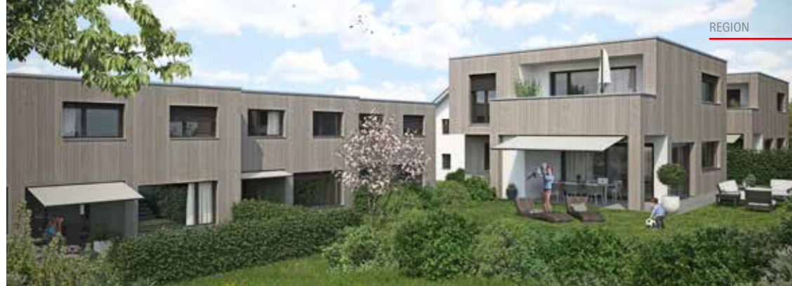
Feldhöhe: Drei verbundene Kubushäuser, zwei moderne Einfamilienhäuser und ein klassisches Einfamilienhaus (im Hintergrund).