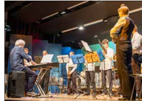
Das Blechbläserensemble der Musikschule Seengen.

Die Musikgesellschaft Seengen sorgte am 17. und 18. Januar mit ihrem Jahreskonzert für zwei unvergessliche Abende. Mit einem abwechslungsreichen Programm, talentierten Nachwuchsmusikern und beeindruckenden Solodarbietungen zog sie das Publikum in ihren Bann.