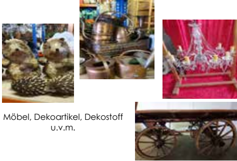
Möbel, Dekoartikel, Dekostoff u.v.m.

Kommen Sie vorbei, es ist für jeden etwas dabei!