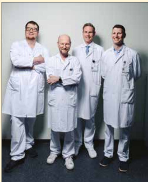
Die Ärzteschaft Chirurgie am Asana Spital Menziken.