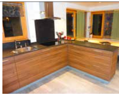
Küchenbau und Geräte-Ersatz