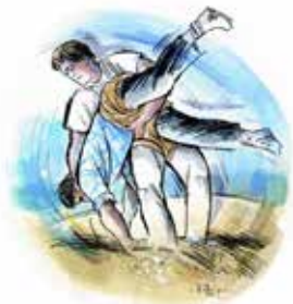
Schwingklub Kreis Kulm