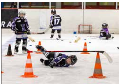
Stürze gehören zum Training und werden auch geübt.

(dah) – Am Samstag, 19. Oktober, startete die Hypi-Hockeyschule des SC Reinach mit rund 40 begeisterten Mädchen und Knaben im Alter von 4 bis 10 Jahren ins neue Eishockey-Training. Pünktlich um 8.45 Uhr betraten die jungen Nachwuchstalente das Eis, um ihre ersten Schritte im Eishockey zu machen. Aufgrund der hohen Nachfrage mussten noch zusätzliche Ausrüstungen organisiert werden, um sicherzustellen, dass jedes Kind optimal ausgestattet ist. Die Hockeyschule besteht aus 15 Trainingseinheiten, die bis zum 22. Februar 2025 stattfinden. Erfahrene Trainer des SC Reinach leiten diese Einheiten und vermitteln den Kindern spielerisch die Grundlagen des Eishockeys. Mit Hilfe von kleinen Toren, Pylonen und anderen Hilfsmitteln konnten auch jene, die zuvor noch nie auf dem Eis standen, ihre ersten Meter auf den Schlittschuhen bewältigen. Wie es beim Lernen neuer Fähigkeiten oft der Fall ist, gehörten auch Stürze dazu, die jedoch dank der vollständigen Schutzausrüstung keine ernsthaften Verletzungen zur