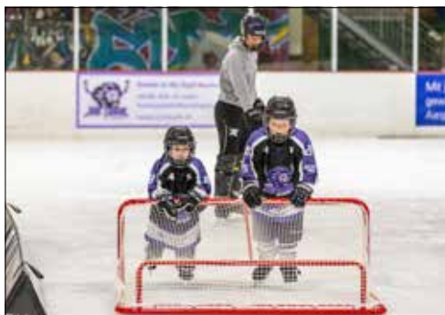
Dank Hilfsmitteln konnten schnell erste Meter gemacht werden.

Am Samstag, 19. Oktober erfolgte der Startschuss der Hypi-Hockeyschule des Schlittschuhclubs Reinach. Rund 40 Nachwuchshockeyspieler versuchten auf dem Eis zurecht zu kommen. Spiel und Spass steht im Training an erster Stelle.