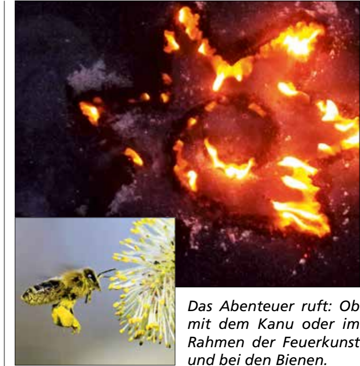
Das Abenteuer ruft: Ob mit dem Kanu oder im Rahmen der Feuerkunst und bei den Bienen.

Wer Feuer und Flamme für die wunderschöne Natur im See- und Wynental ist und diese auf spezielle Arte und Weise gerne entdecken möchte, sollte jetzt unbedingt weiterlesen. aargauSüd impuls wartet mit touristischen Events auf, die von Seetal Tourismus professionell vermarktet werden und auch dort gebucht werden können.