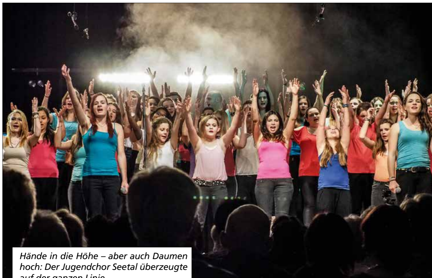
Hände in die Höhe – aber auch Daumen hoch: Der Jugendchor Seetal überzeugte auf der ganzen Linie.