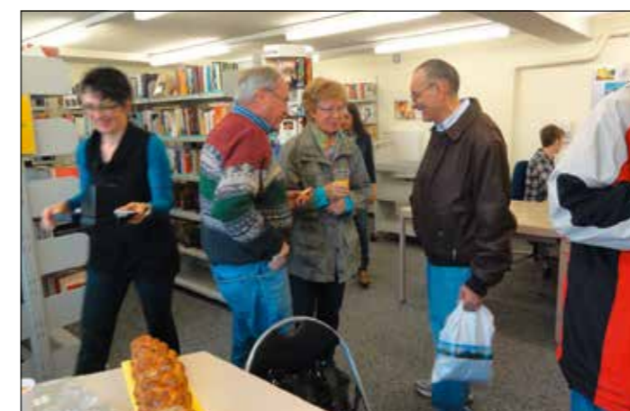
Plausch in der Bibliothek.

Im Hinblick auf das sechste Schuljahr, welches die Schüler im Sommer erstmals ein Jahr länger in der