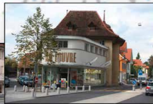
Au Louvre Reinach