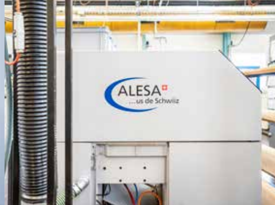
Mit modernsten Präzisionsmaschinen werden erstklassige Werkzeuge für die Bearbeitung von Metall und Kunststoff fabriziert.