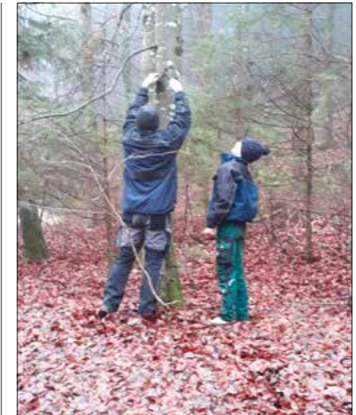
Auch die Kinder halfen fleissig mit.