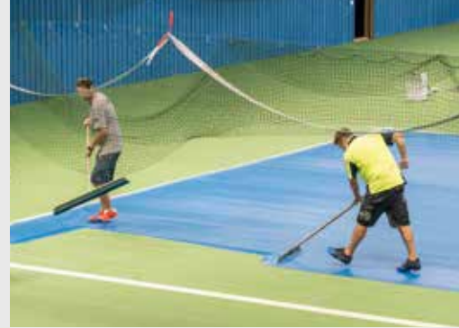
Die Spielfelder erhalten ihre blaue Farbe.