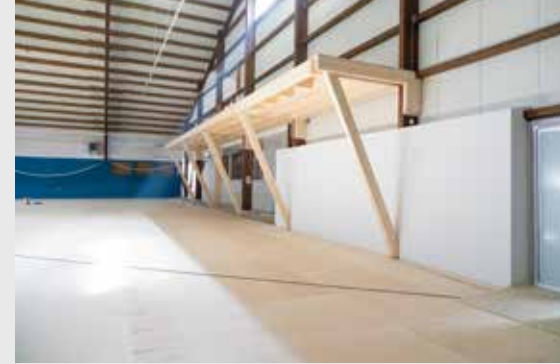
Novum: Die Tribüne, die einen Blick auf die 3 Spielfelder gibt.

lichkeiten. Direkt verbunden mit dem Restaurant ist eine neue Tribüne aus Brettschichtholz, von welcher aus man das Geschehen auf den drei Plätzen hautnah verfolgen kann. Auch alle Bodenbeläge im Innenraum wurden erneuert.