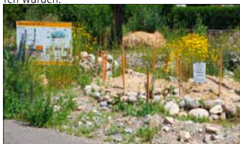
Attraktiv gestaltete Fläche für erdnistende Wildbienen.

Wir würden es sehr begrüßen, wenn Sie bei einem Neu- oder Umbau ein Wildbienenparadies schaffen würden.