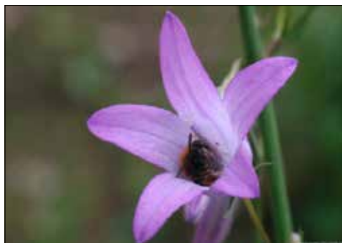
In dieser Glockenblumen-Blüte schläft eine Wildbiene.

Etwa 75 % aller Wildbienen-Arten nisten im Boden. Erdnistende Wildbienen sind auf Bodensubstrate angewiesen, in welche sie ihre Niströhren bohren können. Das sind oft trockene, sandige bis lehmige Böden mit wenig oder gar keinem Bewuchs und guter Besonnung.