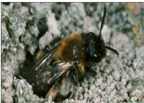
Sandbienen graben für ihre Brut kleine Gänge in die Erde.

Die so genannt erdnistenden Wildbienen sollen im Kanton Aargau mit gezielten Massnahmen gefördert werden. Denn Wildbienen gehören mit den Honigbienen zu den effektivsten Bestäuberinnen unserer Nutzpflanzen und leisten damit für die landwirtschaftliche Produktion einen äusserst wertvollen Beitrag. Von Grünflächen und Gründächern, welche speziell für erdnistende Wildbienen aufgewertet werden, profitieren auch andere Insekten wie Sandwespen, Sandlaufkäfer oder Ameisenlöwen.