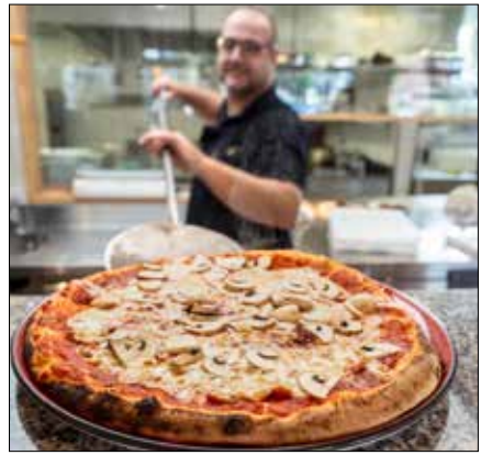
Immer eine Versuchung wert: die Pical-Holzofenpizzen.

Aspekt mit einfließen soll. Am Mittag stehen den Gästen drei Tagesmenüs, eine Tagespizza, ein Wochenhit und ein Fitnessteller zur Auswahl. Klein und fein soll das Angebot sein, wobei auch Vegetarier auf ihre Kosten kommen. Egal ob am Mittag oder am Abend: Ein Besuch im Pical unter neuer Führung lohnt sich auf jeden Fall.