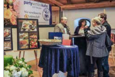
Party-Service Kuhn bei einer Messe auf Schloss Liebegg.

medaille an der internationalen Metzgerfachausstellung 1991 in Zürich war der Anfang. Weitere folgten zum Beispiel mit dem 85 Meter langen Buffet vor 22 Jahren anlässlich einer Ausstellung im Saalbau, dem Sängerkfest Ebikon, wo während dem Festwochenende dreimal 700 Essen zubereitet wurden. «Ein Highlight war der Einsatz an einer Flugshow in Payerne, wo wir 180 Piloten nach ihrem Einsatz verköstigen durften», so Walter Kuhn. Hauptanteil beim Party-Service machen die Hochzeiten aus. 50 bis 55 sind es im Jahr, bei welchen der Menziker Party-Service Brautpaar und Gäste kulinarisch verwöhnt. Dem Einbruch während der Pandemie folgte 2022 ein Rekordjahr. Für den Erfolg verantwortlich sind neben Walter, Barbara und Daniela Kuhn ein Team von rund 20 Personen, die auf Abruf einsatzbereit sind und alles dafür geben, dass den Kunden der Name Kuhn Party-Service weiterhin auf der Zunge zergeht.