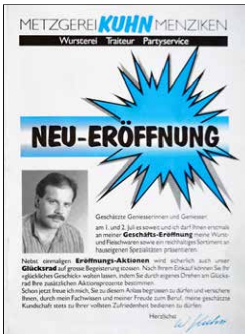
So fing alles an: Flyer für die Neueröffnung der Metzgerei.

(tmo.) – Inzwischen sind 35 Jahre ins Land gezogen. Die Metzgerei als Fachgeschäft an der Bodenstrasse ist Geschichte, wie auch das Engagement als