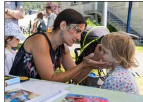
Bezaubernde Kindergesichter entstanden beim Schminken.

Am diesjährigen traditionellen Sommerfest der Schürmatt vom 24. Juni hiess es «Ein Tag im Mittelalter». Wunderschön dem Motto entsprechend hergerichtet präsentierte sich das Gelände und lud so richtig zum Verweilen ein. Gross und Klein erkundeten die verschiedenen Attraktionen.