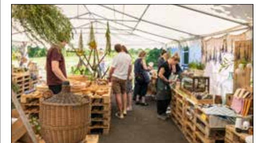
Schöne Gegenstände fand man am Verkaufsstand des Ateliers.

übers Gelände Schlendern fiel das Zelt mit den schönen Gebrauchs- und Dekorationsgegenständen besonders auf. In den Ateliers stellen die Klientinnen und Klienten diese Gegenstände selber. Bei der Qualität werden keine Kompromisse gemacht, denn sie beherrschen ihr Handwerk ohne Wenn und Aber. Verkauft wurde aber nicht nur am Sommerfest, denn auch sonst können diese wunderschönen Gegenstände direkt in der Stiftung Schürmatt im Haus 1 Zetzwil (beim Empfang), Haus 16 Zetzwil (vis-à-vis Apunto) und im Atelier 11 Bünten Gontenschwil gekauft werden.