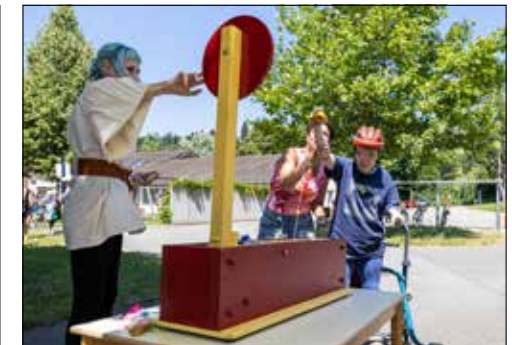
Getroffen: Ein Säckli mit Münzen wurde durch die Luft geschleudert.

(dah) – Bei perfektem Wetter konnte die Stiftung Schürmatt ihr traditionelles Sommerfest durchführen. Dieses Jahr unter dem Motto «Ein Tag im Mittelalter». Bereits im Vorfeld wurden die verschiedenen künstlerischen Beiträge geprobt und die mittelalterlichen Outfits getestet. Mit der fertig aufgestellten Infrastruktur hiess es dann am 24. Juni «Sommer Spectaculus». Über das gesamte Gelände verteilt konnten die Kinder verschiedene Attraktionen wie Karussell, Gumpihuus, Seifenblasen, Schminken, Filzen und Stockbrot besuchen. Bei den Spielständen wurde dann der Wettkampfsgeist geweckt. Mit Hau-den-Lukas, Wurfwand, Handbike-/Rollstuhlparcours und weiteren Ständen wurde es den Kindern nicht langweilig. Tatkräftige Unterstützung bekamen sie durch die Eltern oder die Helfenden. Praktisch hinter jedem Stand oder Attraktion stand ein Mitglied des Teams, welches einen mindestens vierstündigen Einsatz leistete, damit dieses Sommerfest überhaupt auf die Beine gestellt werden konnte. Beim