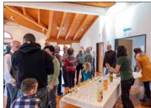
Gemeinsames Anstossen am Neujahrsapéro im Gemeindesaal.

Mit einem stimmungsvollen Neujahrsapéro begrüsst die Einwohnerinnen und Einwohner von Zetzwil das Jahr 2025. Im Gemeindesaal wurden Pläne für die Zukunft präsentiert, Herausforderungen des vergangenen Jahres reflektiert und in geselliger Runde auf das neue Jahr angestossen.