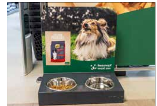
Hunde können gleich ihr neues Leckerli probieren.

nen Bereich mit Zubehör für Nagetiere. Bereiche wie Reptilien- und Fischbedarf sucht man in dieser Filiale hingegen vergeblich. Dennoch besteht die Möglichkeit, sämtliche Produkte über das Bestellsystem der Filiale zu beziehen, was das Sortiment erheblich erweitert. Die Eröffnung unterstreicht das Bestreben von Fressnapf, auch in kleineren Filialen ein breites Angebot und kompetenten Service zu bieten. Ein Besuch in Reinach lohnt sich, um das vielfältige Angebot kennenzulernen und die freundliche Atmosphäre vor Ort zu erleben.