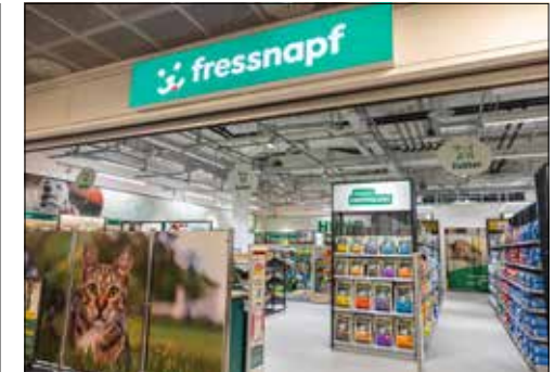
Das moderne Ladenkonzept erstrahlt in neuem Glanz.